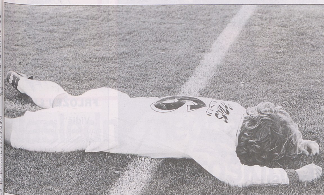
SAK danes ne bi bil na tleh, če poslovodstvo ne bi naredilo toliko napak na športnem področju.