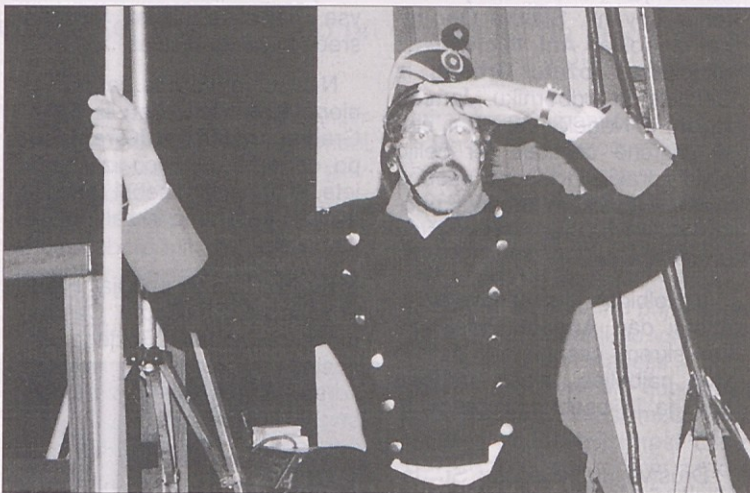
Igralska skupina je steber društva SPD Dobrač. Prizor iz igre „Butalci“ v letu 1994.