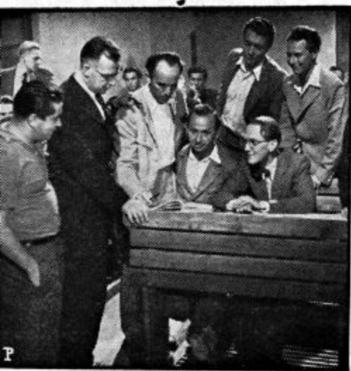
Iz češkega filma »Vražji študentje«. Kino Union.

liji in tako jo je mladi Mozart med leti 1769—1773 trikrat prepotoval. Za tem je prebil štiri leta v rodnem mestu. Leta 1777 je šel z materjo zopet na pot, da si najde prijaznejše duhovno polje kje drugod. Malo časa je bil v Münchenu, zimo 1777-78 pa je prebil v Mannheimu, ki je ta čas slovel po svojem orkestru. Zasedrati se tamkaj ni mogel. Tudi v Parizu, kamor je šel nato, mu to ni uspelo. Vrnil se je nazaj v Salzburg (1779) in zopet vstopil v skromno službo svojega deželnega kneza-nadškofa. L. 1781 se je za stalno preselil na Dunaj. Tu se je poročil s Konstanco Weber. Leta 1787 mu je bil podeljen naslov cesarskega dvornega skladatelja, s katerim so bili zvezani le zelo pičli dohodki. Za krajšo dobo je ponekajkrat zapuščal Dunaj. L. 1787 je za Prago spisal opero »Don Juan« (Don Giovanni) in jo v Pragi sam vodil. Dosegel je v Pragi navdušenje in popolno priznanje. Komaj 35 let star je umrl l. 1791. Neprijaznega zimskega dne so ga pokopali v skupen grob revežev.