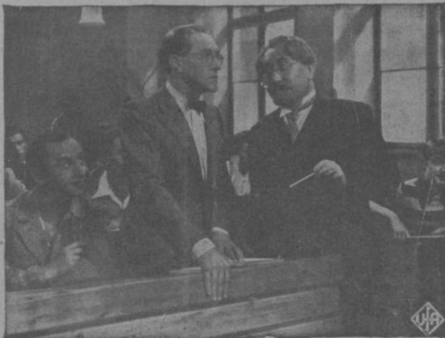
Iz češkega filma »Vražji študentjec«. Kino »Union«.