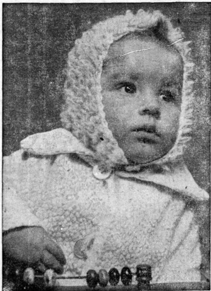
Pazljiva poslušnost pri prvem pouku.

Čim se pojavi na nemškem ozemlju francoski ali angleški avion ob večernih urah, o tem takoj telefonično obveste posamezne postaje, da prekinajo z oddajami. Na ta način tuji piloti izgube glavno možnost orientacije