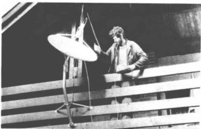
Akcija v Spodnji Rečici je bila zastavljena tako kot je treba, delavci PAP-a pa so več kot soliden partner (na sliki levo)

(tp) Smartno ob Paki. Kot vse kaže, bo pobuda, izrečena na lanskem zboru krajanov v Smartnem ob Paki o ustanovitvi turističnega društva v kraju, naposled uresničena. V petek, 23. marca ob 19. uri bo namreč v tamkajšnji dvorani kulturnega doma ustanovni občni zbor, vseh, ki jim ni vseeno, v kakšnem kraju živijo in delajo. Ob tej priložnosti bodo krajanje lahko prisluhnili tudi zanimivemu predavanju o okrasnem cvetju.