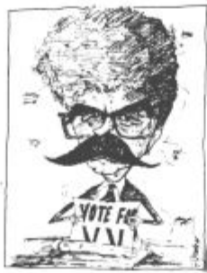
Piše: VINKO VASLE

Pred dolgimi leti so mi predstavniki kitajske partije na vsako provokativno vprašanje najprej odgovorili z lepim nasmehom, potem pa me opozorili, da ne smem pozabiti, da imajo bando, ki je v tej deželi kriva za vse. Zadnjič mi je še kar pomemben »republiški« Slovenec dejal, da imamo tudi Slovenci svojo »bando četverice« — nekoga pač, ki ga lahko okrivimo za vse, kar nas je volja. Mi imamo zdaj Srbe in njihovo gospodarsko blokado! Ko se nam je sesul Maribor, so nekateri začeli hitro računati, koliko so tega krivi na jugu. Ko so potresi desete gospodarske stopnje zajeli tudi Ljubljano in so se nekateri njeni gospodarski paradni konji sesuli kot hišica iz kart, so »obveščeni« rekli — spet Srbi. In tako v nedogled.