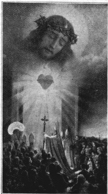
Sveto leto ob 1900 letnici Odrešenja 1933