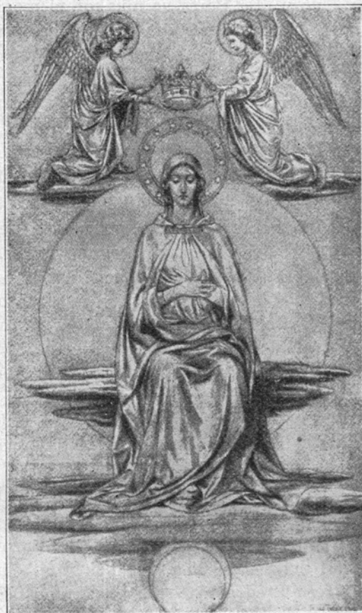
F. Fuchs: Brezmadežna