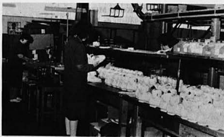
Natančen pregled pred pakiranjem