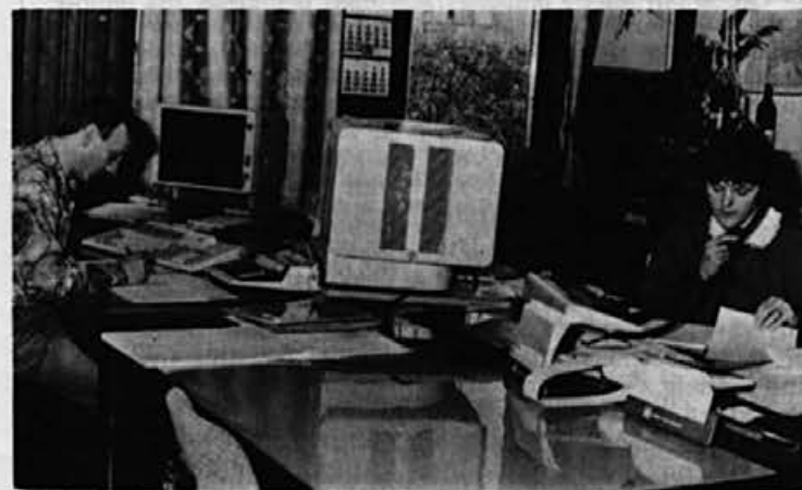
Zaloge spremljajo z računalnikom