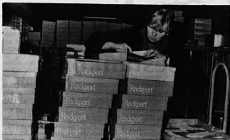
Preden pošljemo blago naprej, je treba pogosto kaj popraviti