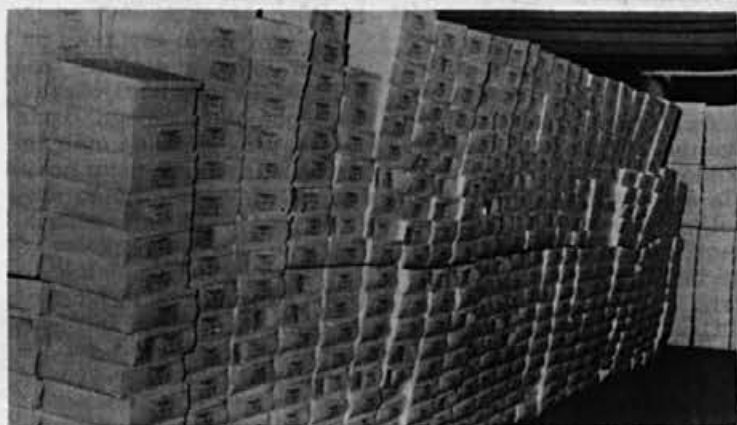
Skladišča so zatrpna z obutvijo, ki je namenjena za Sovjetsko zvezo