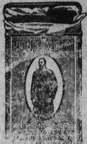
Na drugi strani Prince Albert zavija je štitiš Prince Alberta 30. julija 1907.

Prince Albert tobak se je vedno prodajal brez kuponov ali premij. Mi damo raje kakovost. Tako, da boš, kadar denesh Prince Albert v pipo ali ga zviješ v cigareto, dobiš šele osebno informacijo o istiniti kakovosti katero najraje uživaš! Ker je popolni namen Prince Albert kakovost brez kuponov ali premij, ni njega prodaja prizadeta ne z vladno in ne z državno prepovedjo njih rabe.