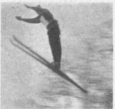
Posnetek z uspešnih skakalnih tekem