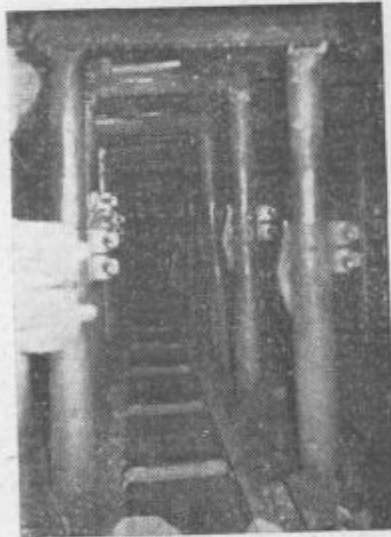
Mehanizacija olajša naporno delo rudarja, dviga storilnost dela in doprinaša k povišanju mesečnih osebnih dohodkov rudarjev.

Smotno uvajanje »delne ali polne mehanizacije in avtomatizacije« osnovni pogoj za reševanje velikih gospodarskih nalog.