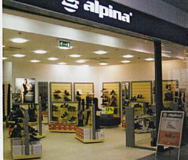
Prodajalna v Mercator centru v Postojni

• Kljub krizi, ki se dogaja v svetu, skušamo biti v prodaji prodorni in osvojiti druge trge tudi v republikah bivše Jugoslavije. Zavedamo se, da je to težko, a s svojo kakovostjo bomo načrtovano dosegli.