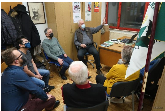
Predstavitve naĉrta delovnanja knjiŝnice in ĉitalnice ZES

Po preselitvi na Grabloviĉevo smo takoj kupili knjiŝne omare in jih napolnili po naĉrtu razporeditve fonda. Odloĉili smo se za grupiranje knjiŝg po vsebinah kot prvem kriteriju ter za razvrstitev v okviru vsebine po ĉasovnem zaporedju izhajanja kot drugem kriteriju. Knjiŝge bodo tako tudi oznaĉene z inventarnimi ŝtevil-kami, ki bodo hkrati tudi signature. Od tega pravila bomo odstopili pri knjiŝgah izredne velikosti, ki ne morejo v police, ter pri zelo majhnih ali drugaĉe posebnih enotah.