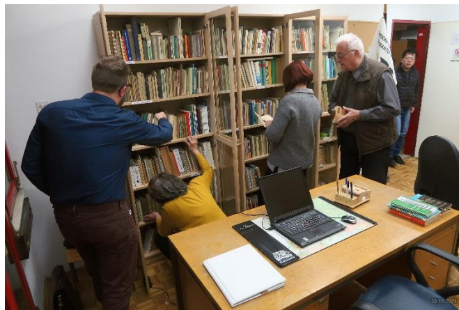
Raziskovnanje knjiŝnice je poseben uŝitek

Posebna programa ni bilo, smo pa spregovorili o zgodovini in stanju knjiŝnice ter o naĉrtih za ureditev knjiŝnice in delovnanje »knjiŝnega servisa«. Potem smo seveda posneli obvezno »gasilsko sliko« ter se rozdili v skupino, ki je brskala po knjiŝnih omarah ter v skupino, ki je v predsobi ob dobrotah ĉakala, da pride do menjave. Pogovori v ŝivo so letos redkost, saj je bila ta otvoritev ŝele tretji letoŝnji dogodek (poleg proslave na Lisci in izleta v Almino Celje) s fiziĉno prisotnostjo.