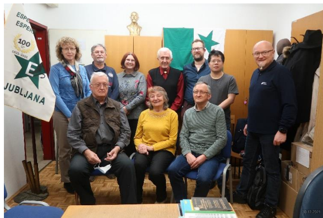
Samo za zgodovino smo vsi sneli maske