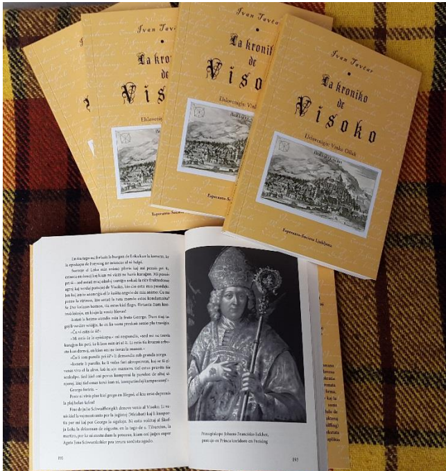
Freisinški knezoškof in njegov fevd Škofja Loka

Knjiga je zdaj na tržišču, uvrščena je v prodajni katalog UEA – Libroservo, imajo jo NUK in glavne esperant-ske knjižnice. Pripravljajo se recenzije in čakamo na kritike v literarnih revijah. Kmalu bomo torej videli, kakšne so ocene in odzivi bralcev, zlasti esperantistov, ki ne poznajo slovenskega izvirnika. Upamo, da bodo po njej segli tudi mnogi domači bralci.