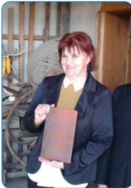
Valika v Markovcaj

ričko, če se kaj dogaja ali nej? »Tak vejš, namé nika vleče ta prejk, zato ka moje korenine so tam. Tam sta se narodila baba