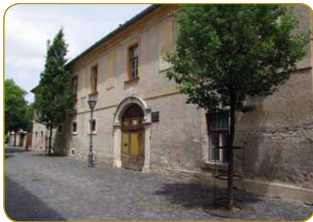
Tak gnes v Kőszegi vővidi zidina Kelcz-Adelffynove sirotišnice, štera je dala dosta vőnavčeni lidi vogrskim Slovincem

nik Božidar Raič je gnauk dojspiso, ka »ta šaula je kovačnica, gde s Slovincov Madžare kovéjo«.