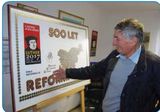
Tri mesece je nüco, ka je napravo spominski plakat

31. oktobra de minaulo ranč 500 lejt od tistoga dneva, gda je Martin Luter na dveri cerkve v Wittenbergi zabiu 95. tez