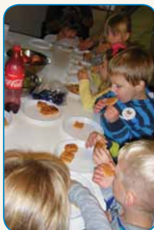
HIŠO JABOLK SO NAPOLNILI... stran 6