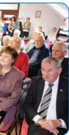
love družine obiskalo lepo in Madžarske

Zunaj pred sedežem je sonce počasi zahajalo za cerkvijo.