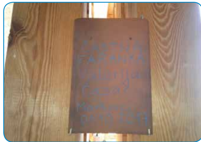
Tabla častne faranke eno leto visi na farofi v Markovcaj

»Dja sem še v življenji nikanej dobila, nišo priznanje, ka bi mojo delo priznali, tak ka mena je tau trno veliko delo bilau. Naši so tak tō prajli, kak so ponosni na mene, ka sem dja tau dobejla. Tak mislim, potom toga eške več moram včiniti, eške več moram na znanje dati, ka se na Goričkom godi pa če kakšni programi djestejo, te, če leko, tam moram biti.«