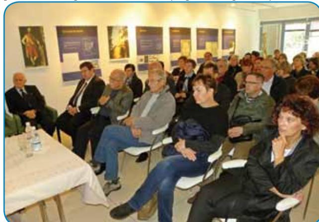
Odlično obiskana okrogla miza