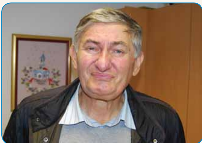
KEJPO SE JE S ŠTIRIMI PREDSEDNIKI ROSAGOV stran 4