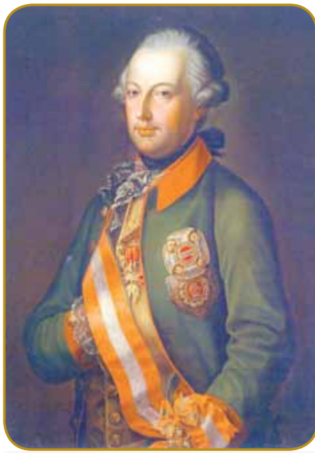
József II. se je nej dau kronati, zatok so ga na Vogrskom radi zvali »krau s klabükom«

vogrski pogučavati, slovenski podje so se vogrski navčili najkisnej do tretjoga klasa. Od toga je prišo glas na drugo stran Müre tő, dūhov-