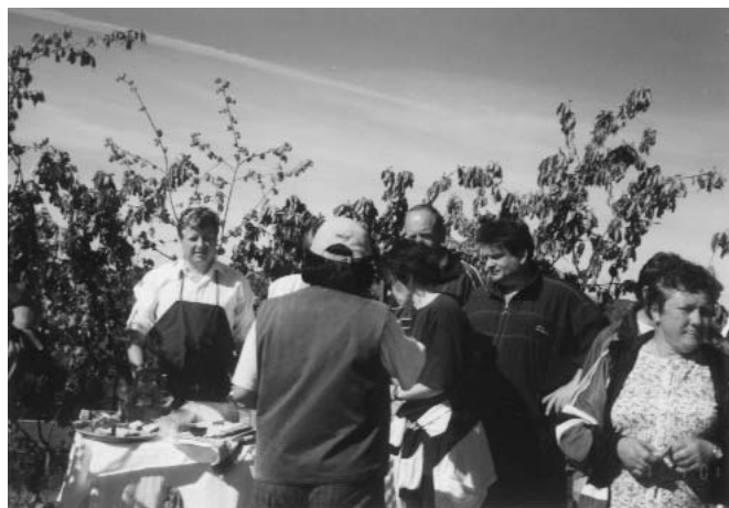
Na kmetiji Lovrec