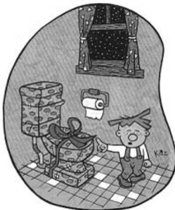
"Mama, a boš jezna, če odprem tole darilo pred Božičem?"

Zjutraj sem lahko ugotovil le še to, da sem pozabil potegniti vodo in splahniti školjko po uporabi.