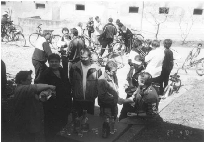
Na kmetiji Zelenik