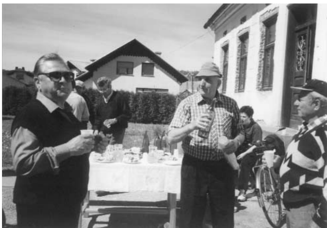
Na kmetiji Žampa