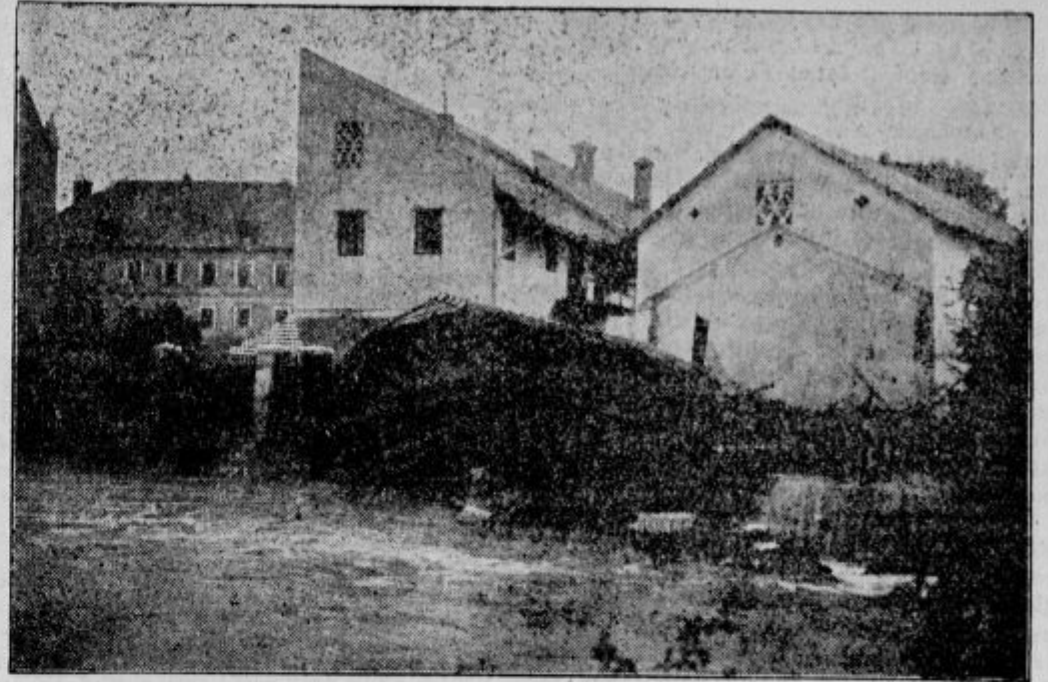
Skoda, povzročena po Gradaščici nad mostom pred trnovsko cerkvijo.