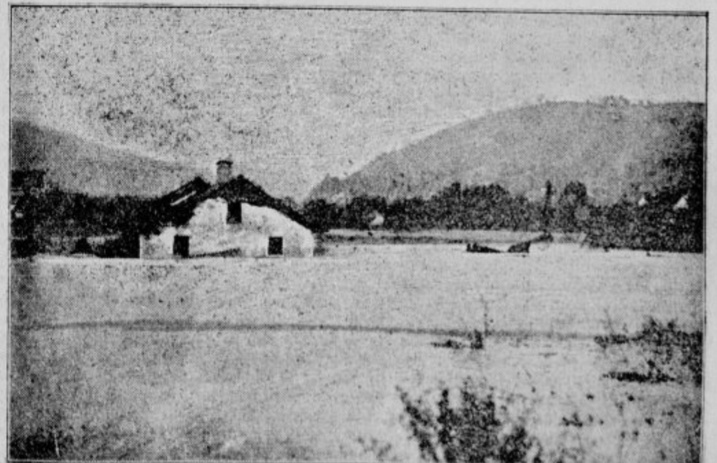
Poplava ob izlivu obeh Sor v Škofji Loki.