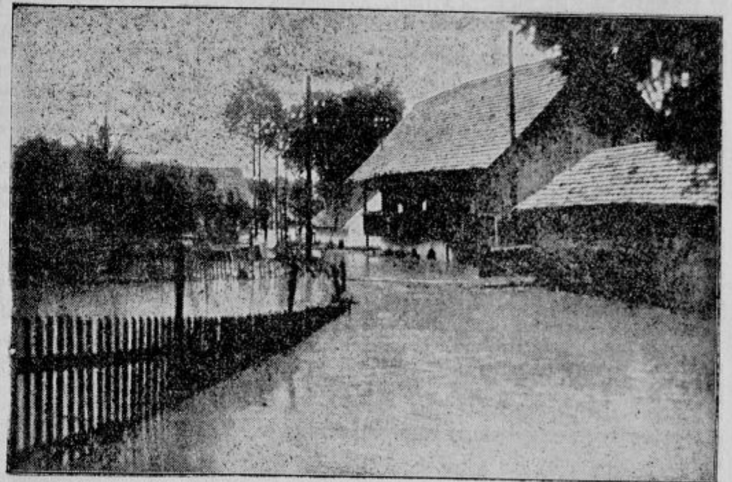
Poplava v Škofji Loki na »Studenc« .