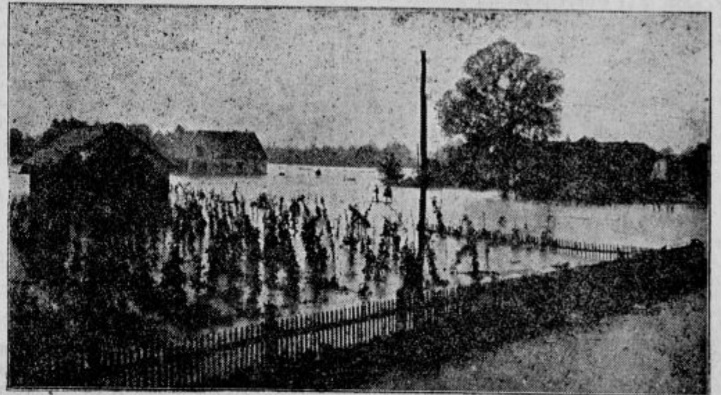
Poplavljeni »Kern« v Trnavi.