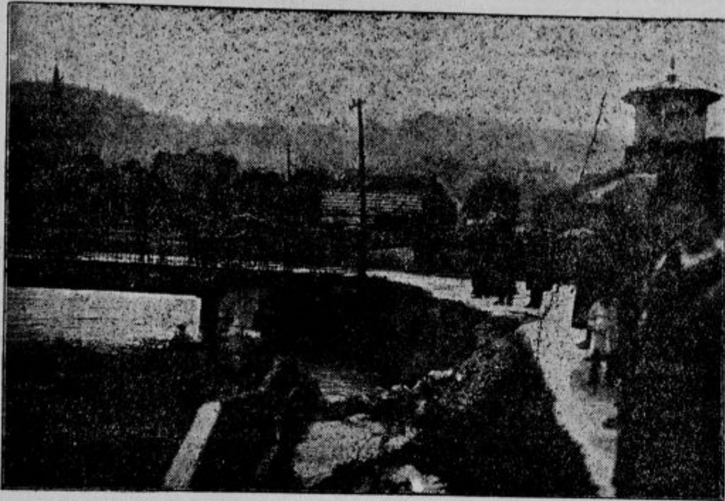
Pogled na Gradaščico pred izlivom v Ljubljano.