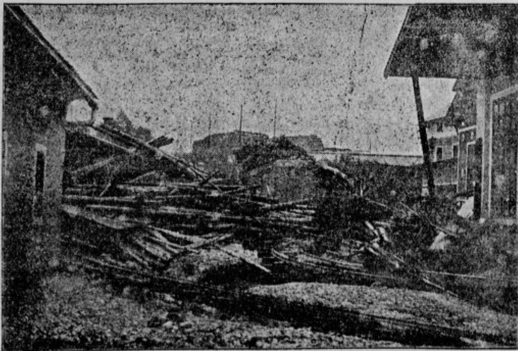
Pogled na ruševine v papirnici v Goričanah pri Medvodah.