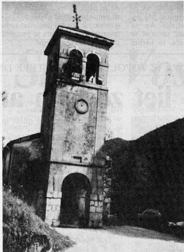
Ta stara cirkow tuw Učtj zunaj...

Il comitato si assume quindi l'impegno di portavoce della volontà della popolazione di Uccea, fermamente decisa a ristrutturare la chiesetta risalente al 1888. La chiesa, dedicata a S. Antonio di Padova, patrono del paese, è costata molti sacrifici ed è principalmente per rispetto verso coloro che l'hanno costruita e per amore delle antiche opere, che la popolazione di Uccea ha deciso di promuovere questa importante iniziativa. La Chiesa, già restaurata nel 1927 e nella quale si officiavano le