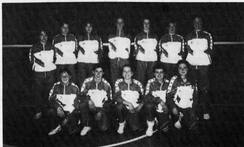
La squadra femminile al gran completo

Continua la marcia trionfale della compagine di Prima divisione femminile di pallavolo della Polisportiva S. Leonardo che, giunta al giro di boa del proprio campionato, si trova sola al comando ed incomincia ad assaporare sempre più la dolce idea della promozione alla serie D regionale.