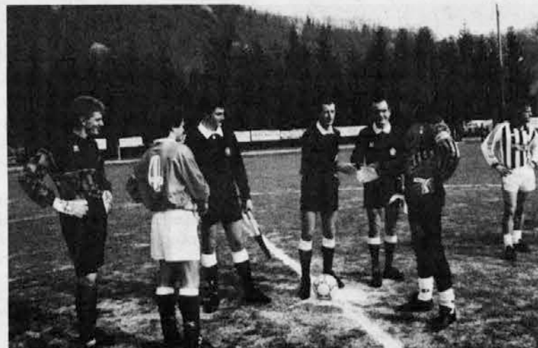
I preliminari della gara tra Valnatisone e Udinese