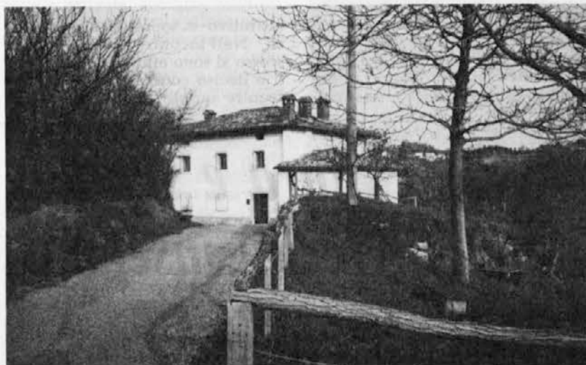
Tel je pa faruž