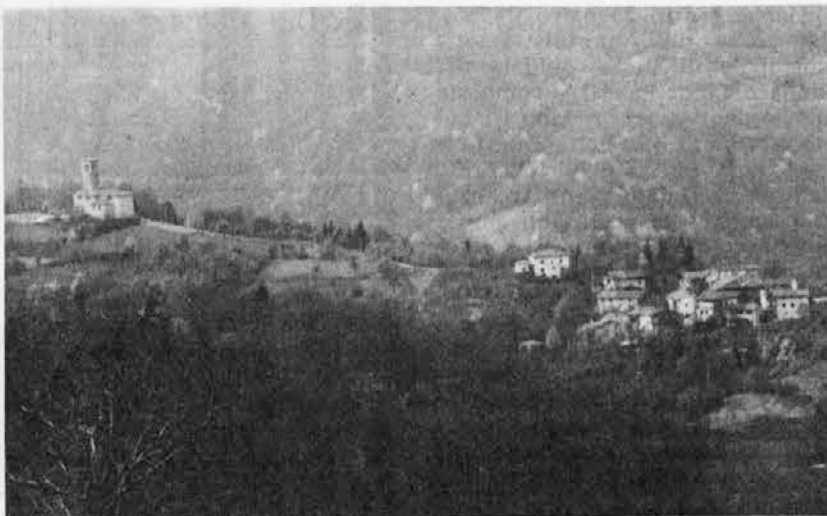
Pogled na Černeckje