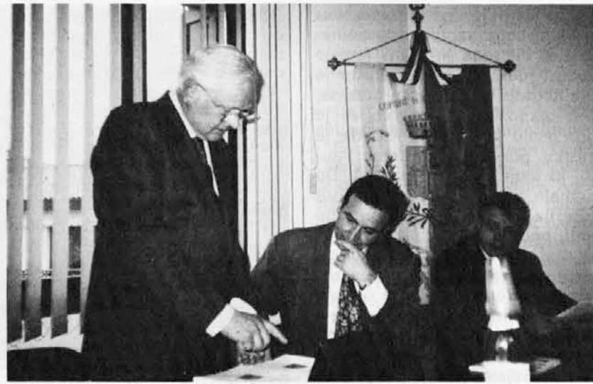
Un momento dell'incontro con i due sindaci

Attraverso di essi, infatti, le due Amministrazioni intendono, oltre che migliorare la conoscenza reciproca sotto l'aspetto sociale e culturale, anche scambiarsi idee, suggerimenti e utili proposte per comuni problemi di carattere ammi-