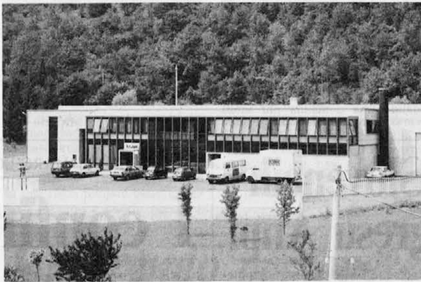
La sede della Kronos a Cemur di S. Leonardo