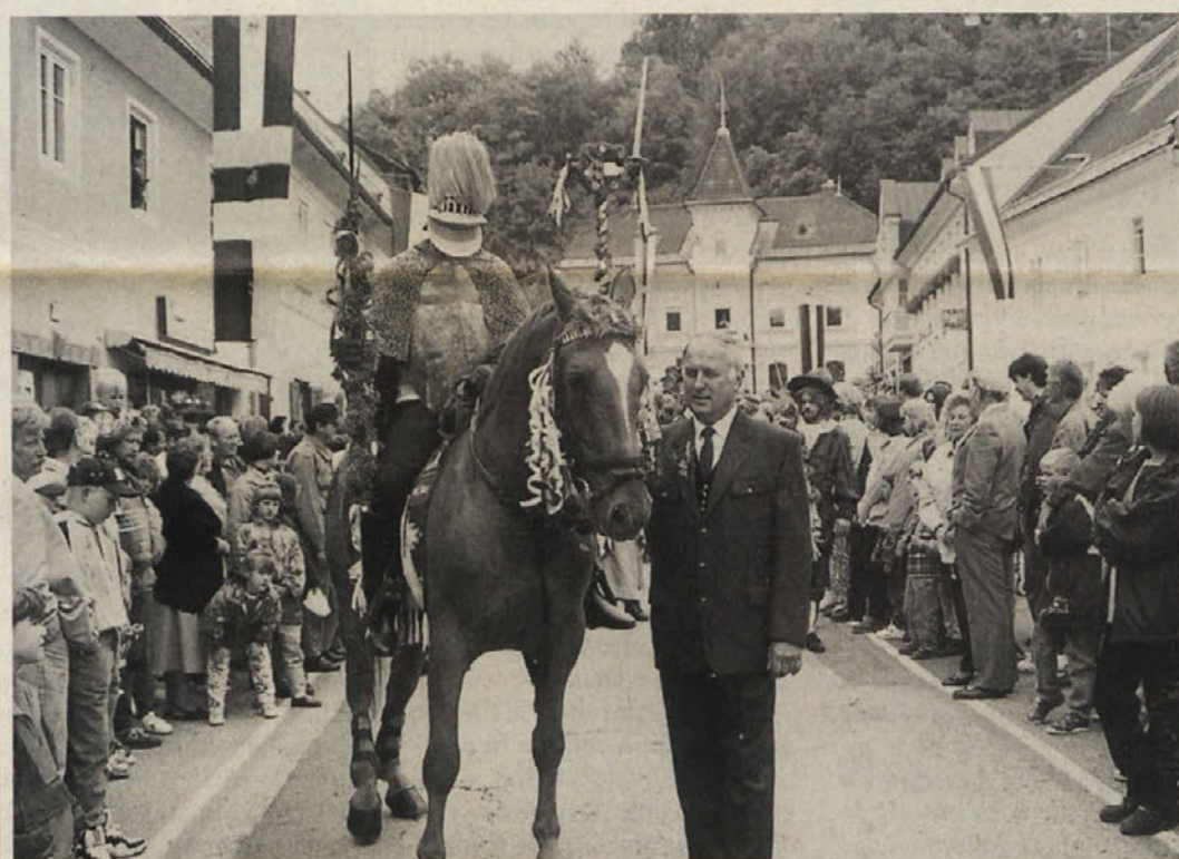
Pliberški sejem bo tudi letos največja prireditev na južnem Koroškem. Velikega pomena je za čezmejni blagovni promet, pa tudi za navezovanje poslovnih in kulturnih stikov.