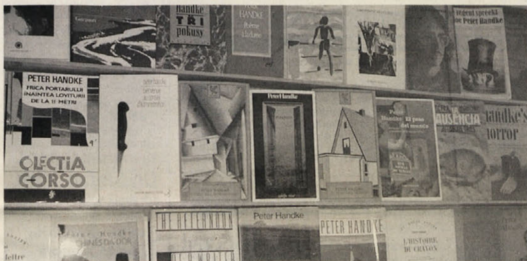
Razstava o Petru Handkeju v Grebinjskem samostanu, na kraju, ki ga srečamo tudi v njegovi literaturi

Peter Handke – eine Ausstellung. Grebinjski samostan. Do 26. oktobra 1997, od torka do nedelje, od 10. do 15. do 19. ure.