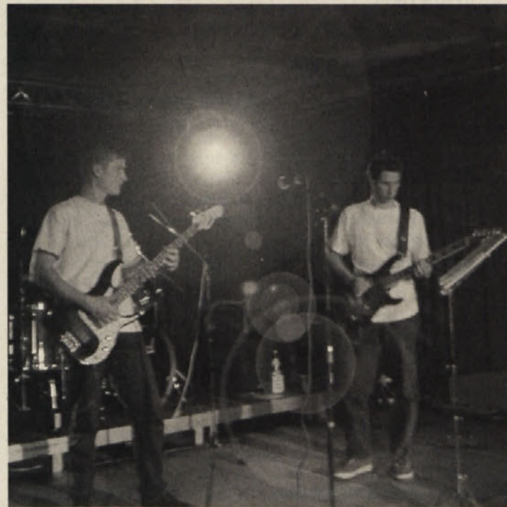
Gigant II se je predstavil v k&k-centru v Šentjanžu. Z lastnimi skladbami in velikim občutkom za hitre ritme