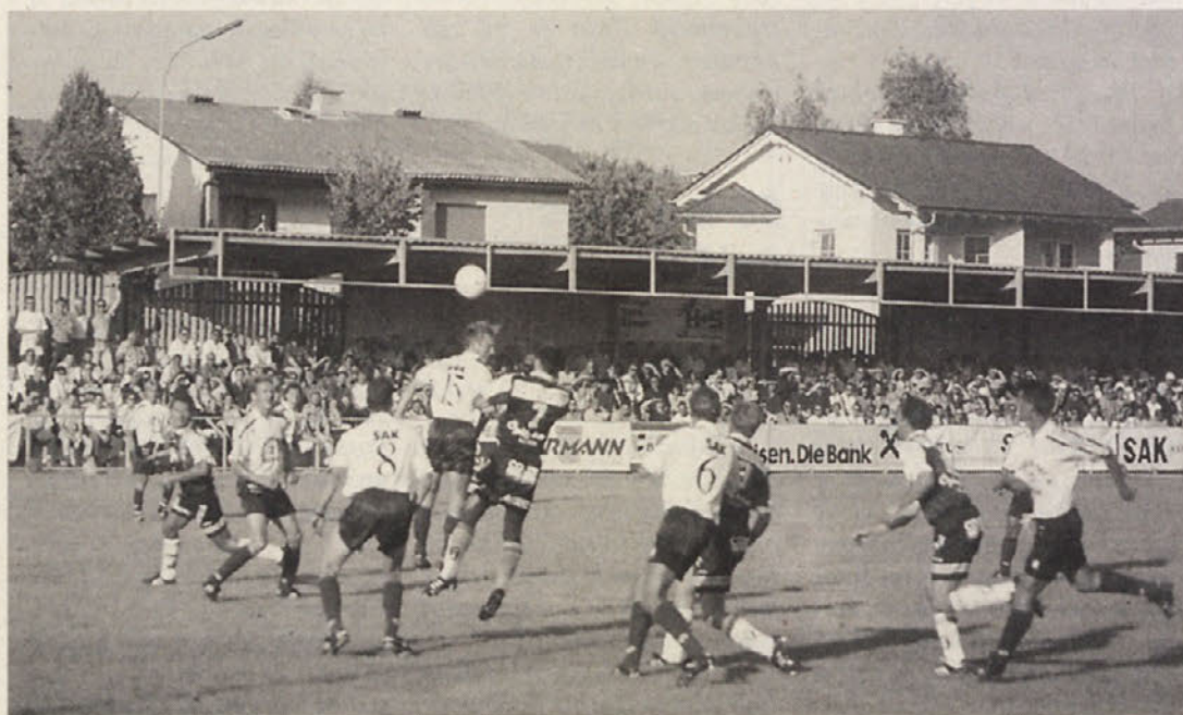
Igra je bila borbena, a manjkalo je golov. Navijačem pa gotovo ni bilo dolgčas.