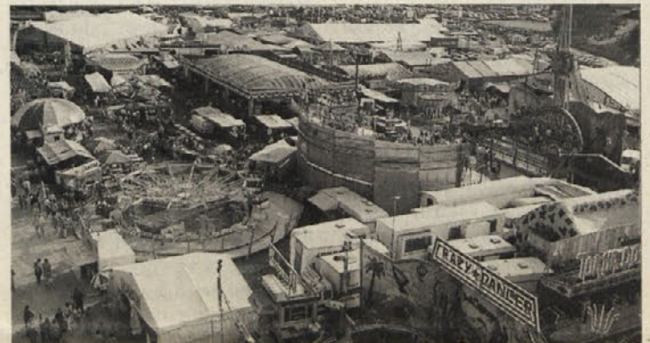
Ne le sejem, tudi zabavišni park privabi veliko ljudi. Letos bosta na ogled in v zabavo dve novi napravi prvič na Koroškem.