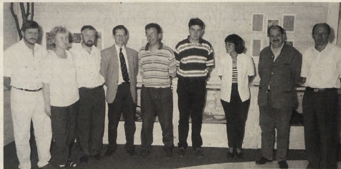
Skupinska slika z ministrom Školčem (v sredini) pred razstavno vitrino