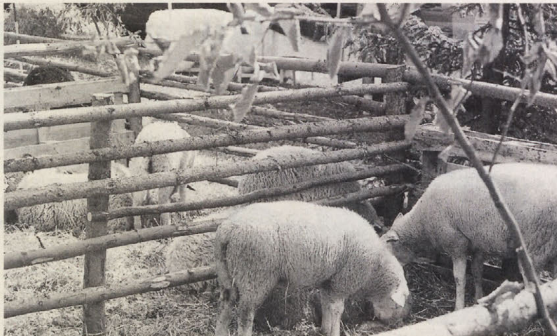
Čeprav jih je bilo le za vzorec, pa so bile v zasluženem središču pozornosti ovčjega dne

Prireditve je pripravila Kmečka izobraževalna skupnost. Pohvalno da že dober mesec po svojem občnem zboru. Zanj so