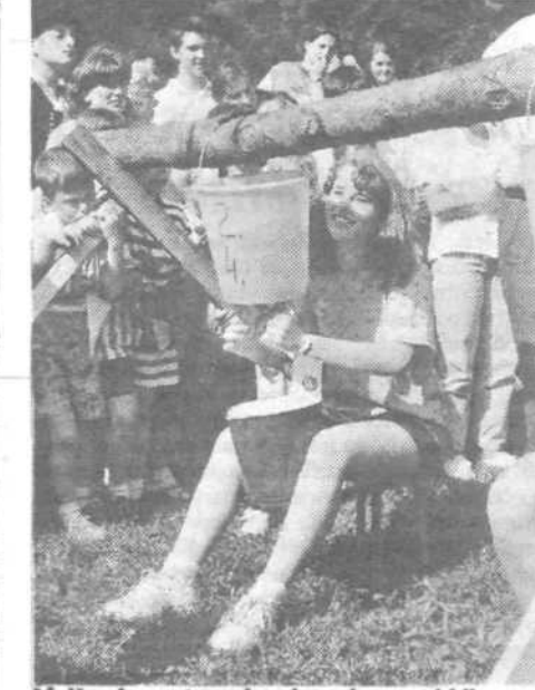
Molja ob umetnem kravjem vimezu ni bila nič lažja od navadne