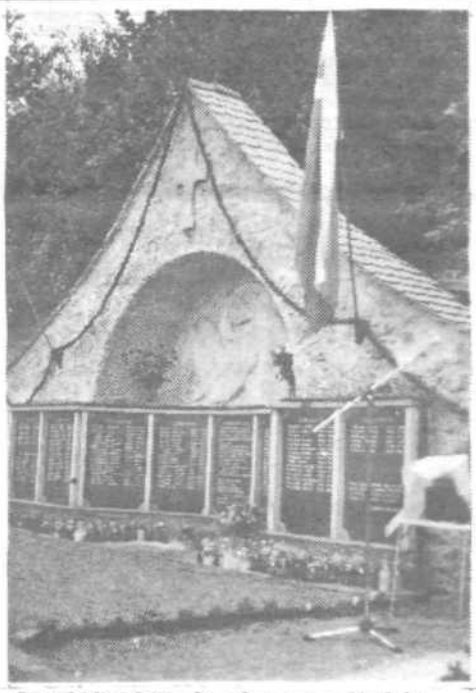
Spominska plošča domobrancem v Horjulu