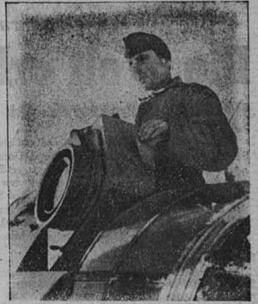
Oko izvidnika, ogromni fotografski aparat za letala, vgradi tih pred poletom na izvidniško letalo.

leg tega pričakujejo v Severni Afriki prehranjevalne težave in nemire velikega obsega, kjer so Angleži in Amerikanci, kot povsod, močno zbegali gospodarsko življenje. Tukaj kot povsod drugje je prišla z njimi lakota. Celih 9300 ton je bilo baje uvoženih za civilno prebivalstvo, toda že sedaj nazznanjajo, da se bodo prihodnje živilske dobave komaj nadaljevale.