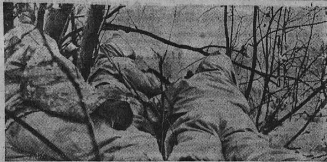
Ogledniška četa napreduje na srednjem odseku vzhodne fronte. Sedaj se zavaruje povratek.

tiko, hočejo pač poskusiti, da začnejo z odstranitvijo precejšnjih prehranjevalnih težkoč, katere ima že en del zaveznikov, drugi pa so tik pred njimi. Iz odbora za zunanje zadeve washingtonskega senata je bila objavljena izjava Stettiniusa, šefa posojilnega in zakupnega gospodarstva, po kateri so poslale Zedinjene države od marca 1941. dalje »zaveznikom« štiri milijone ton živil in drugega, od tega 2.9 milijonov ton Sovjetski uniji. Stettinius je pripomnil, da je prehranjevalni položaj Sovjetov sedaj kritičen in bo v doglednem času še slabši. Po-