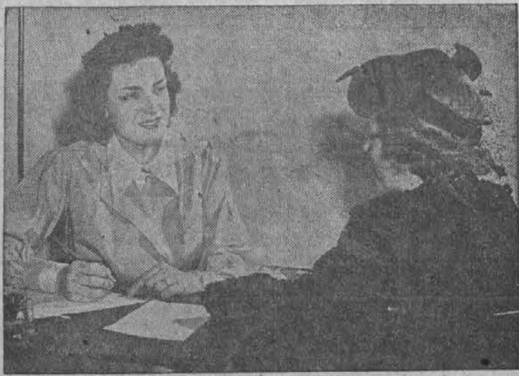
American Red Cross clerk takes application of a Blood Donor

Red Cross Now Accepting New Blood Donors