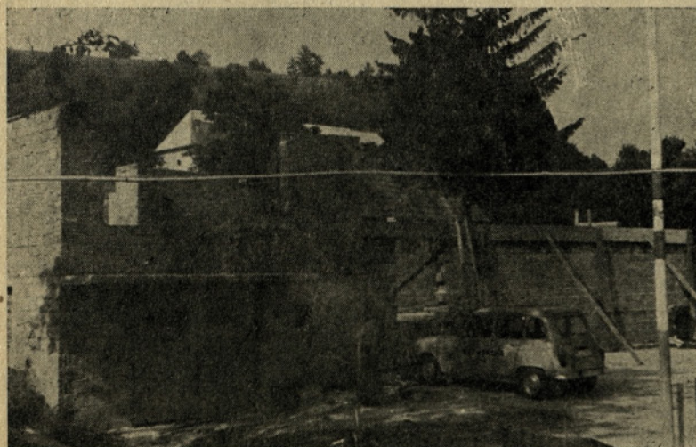
Kulturno življenje v Šentvidu bo lahko še bogatejše