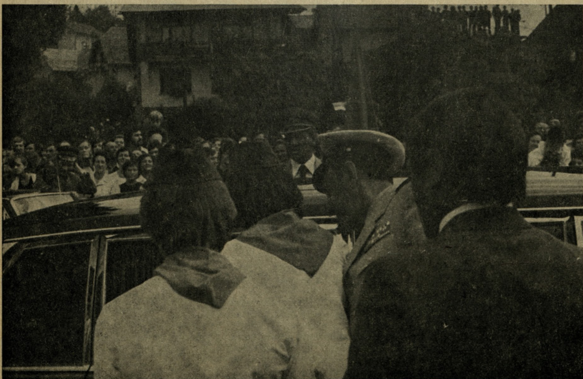
Sentjurčani pozdravljajo najdražjega gosta

Kolikor najbolje sem mogla, sem mu dejala: »Dragi naš tovariš Tito! Ponosni in srečni smo, (Nadaljevanje na 2. strani)