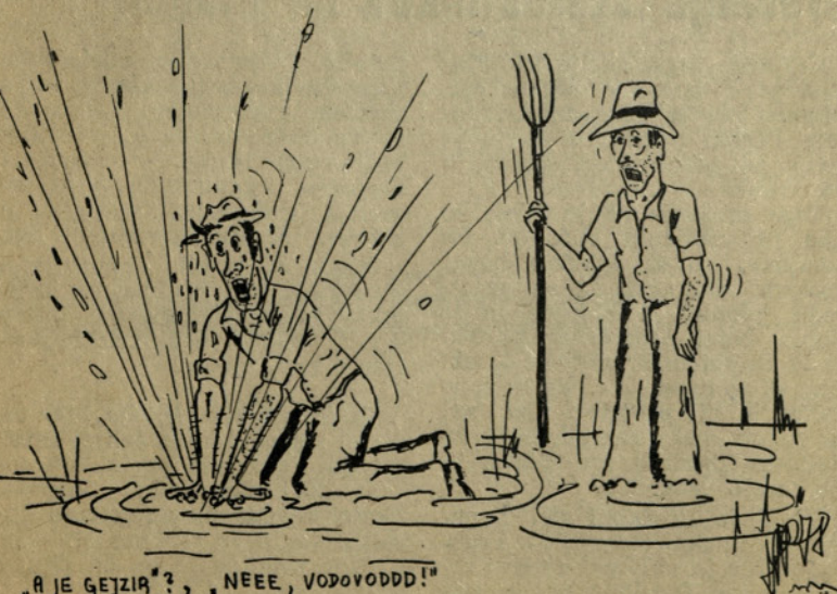
»A JE GEJZIR?«, »NEEE, VODOVODDD!«