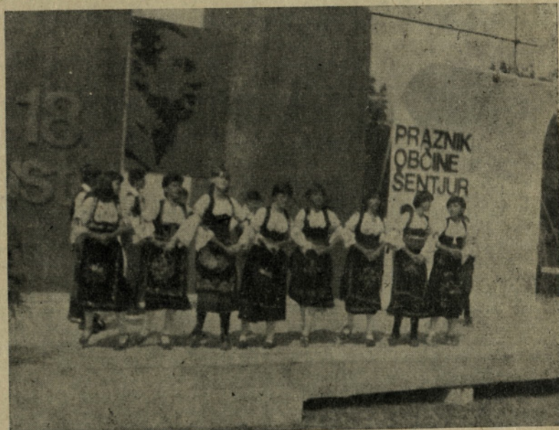
Zaplesali so naši gostje iz Požege