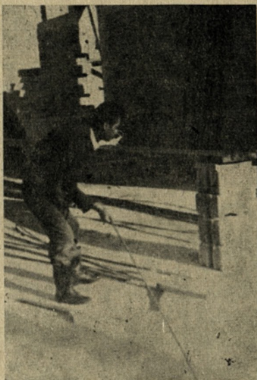
Tudi posameznik prispeva svoj delež

V delo žele vključiti nove člane, zlasti mladino in tako nadaljevati s tradicijo na Kozjanskem. Društvo se zaveda, da bodo lahko le s kvalitetnimi uprizoritvami pritegnili širši krog poslušalcev. Zato niso pozabili