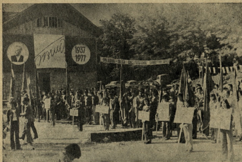
Srečanje MDA Jugoslavije

tem ljudem — Kozjancem. Začeli so s solidarnostno akcijo gradnje vodovoda in elektrifikacije. Naslednje leto je Kozjansko postalo republiška mladinska delovna akcija. Leta 1975 pa je bila ta akcija proglašena za prvo zvezno mladinsko delovno akcijo v Sloveniji. Zanimanje za akcije se je iz dneva v dan večalo. Vedno več mladih je želelo sodelovati na mladinskih delovnih akcijah, tako v naši republiki kot izven nje. Nujno je bilo potrebno podpisati družbeni dogovor, ki je začel načrtovati in točneje opredeljevati MDA v Socialistični republiki Sloveniji. S tem družbenim dogovorom so MDA v Sloveniji zopet postale izvajalec družbenoekonomskih nalog in s tem dobile nadvse pomembno vlogo. Letos so na akcijo prišli že tudi prvi brigadirji iz tujine: dva Francoza, pet Romunov, Turek in zamejski Slovenci iz Trsta in okolice.