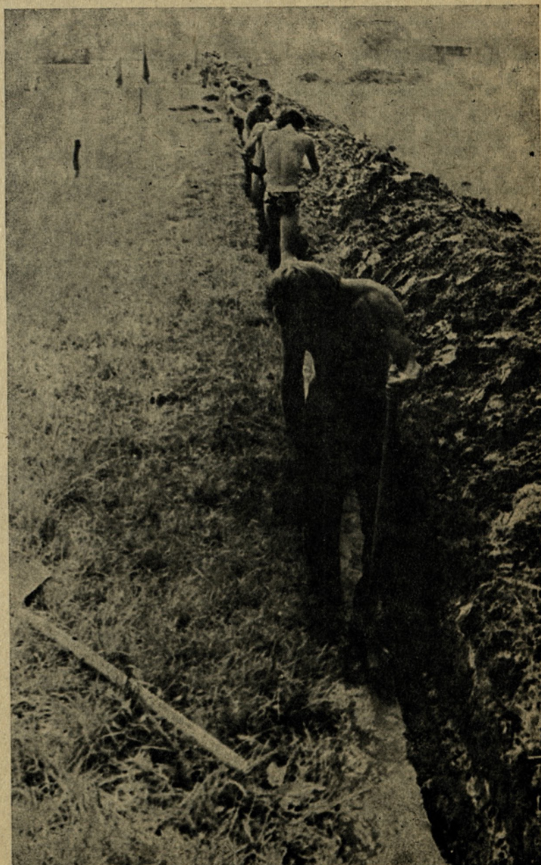
Tudi telefonski kabel je potrebno prestaviti