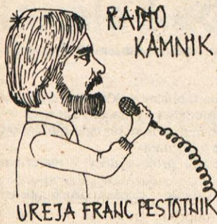
UREJA FRANC PESTOTNIK