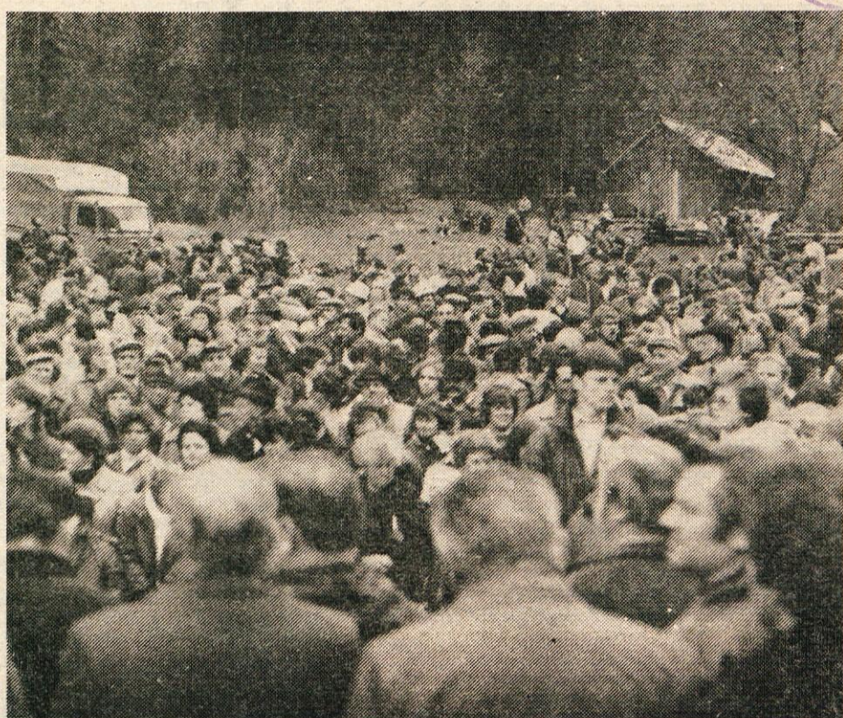
V Kamniški Bistrici se je na tradicionalnem delavskem srečanju tudi letos zbralo več tisoč ljudi