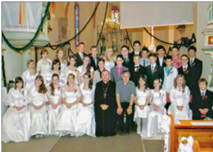
birmance - v soboto, 12. maja 2012