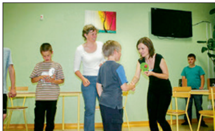
Podelitev oskarjev za najboljše vloge in izvedbe ...

V soboto zjutraj so tako učenci kot učitelji šolske prostore zapustili polni prijetnih vtisov.