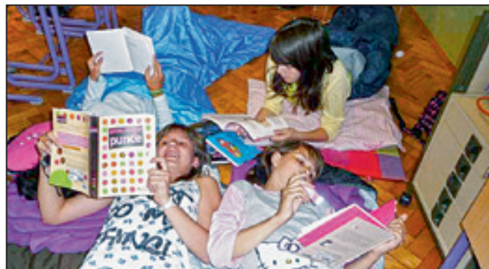
... potem pa s knjigo spat!