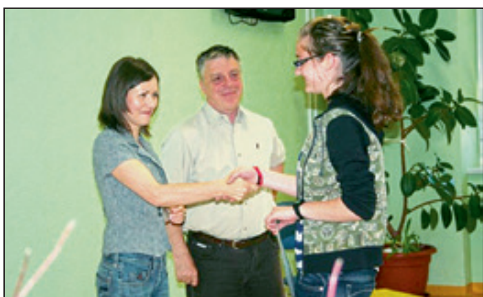
Sledila je podelitev priznanj bralcem, ki so prvi zaključili bralno značko.