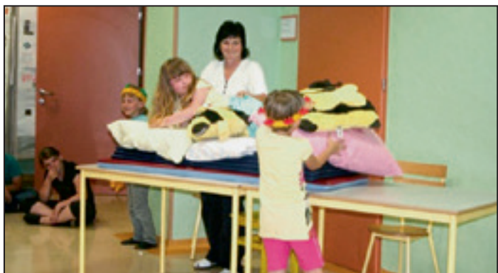
Kraljična (iz 1. razreda) se trudi zaspati na zrnu graha.