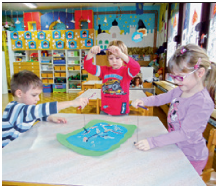
Mali raziskovalci v Središču ob Dravi