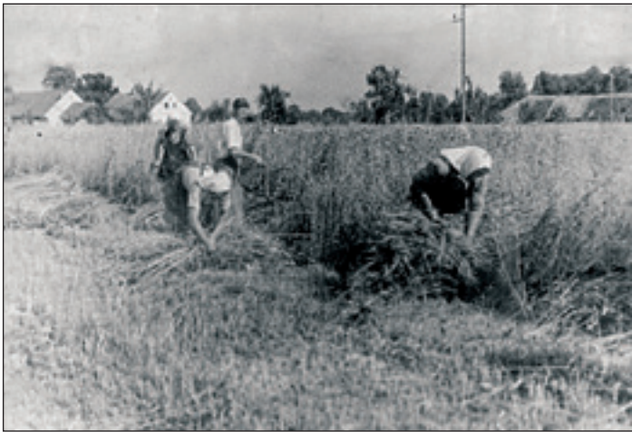
Žetev pšenice v Obrežu, okrog 1950

Po informacije sem se spet podal k mojemu stalnemu viru v Jacino. Kakšna je bila tradicionalna žetev tam nekje v petdesetih letih prejšnjega stoletja, dragi (starejši) bralci? Se še spomnite? Gotovo ste ohranili v spominu zgodnje vstajanje in odhod na njivo, ko še ni pripekala huda vročina.