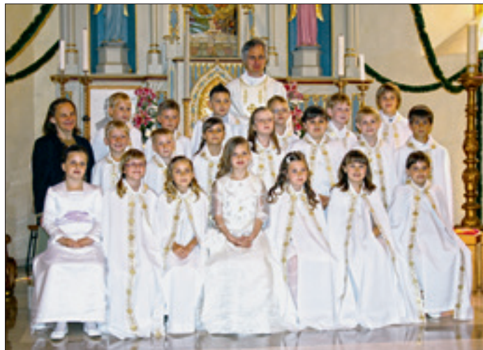
in prvoobhajance - v nedeljo, 20. maja 2012