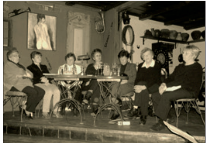
Večer za kulturo, april 2012

Novost v kulturni ponudbi društva pa so literarni večeri, kjer je prišlo do sodelovanja dveh društev, pa tudi dveh generacij. »Akcijaši« in domače ljubiteljice literature, ki se že nekaj časa redno zbirajo, slišijo pa na ime »Literarna ulica«, so združili moči in to pomlad izvedli dva literarno - glasbena večera. Bilo je lepo, dobro obiskano in za dolgo zasidrano v spomin vseh aktivno in pasivno prisotnih.