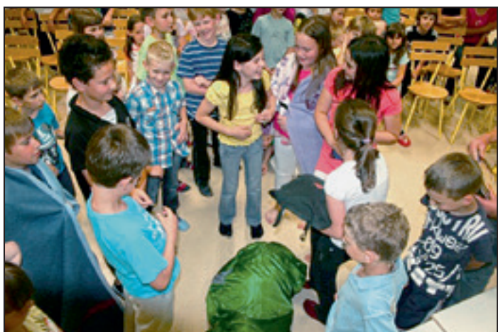
Učenci 4. razreda, zbrani okrog svojega »graha«.

V petek, 25. maja 2012, smo na šoli organizirali zaključek bralne značke z naslovom S knjigo spat . Mentorice so se namreč odločile, da bodo z učenci vseh razredov, ki so osvojili slovensko in nemško bralno značko (teh je bilo kar 117), na šoli preživele celo noč.