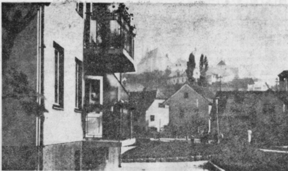
Detajl iz Sentjurja. Novo združeno s starim. Moderni bloki pod Starim trgom, kjer je bilo včasih središče Sentjurja. Nova oziroma samo dobro obnovljena cesta, ki povezuje naselje Sentjur, bo še okrasila kraj.