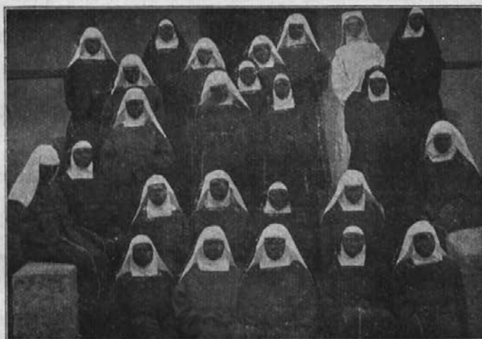
Črne sestre domačinke.

„Morebiti pa še ne veste, da je mogoče priti po smrti v nebesa, ali pa v pekel?“