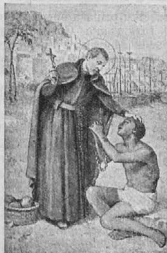
Sv. Peter Klaver apostol zamorcev, prosí za nas!