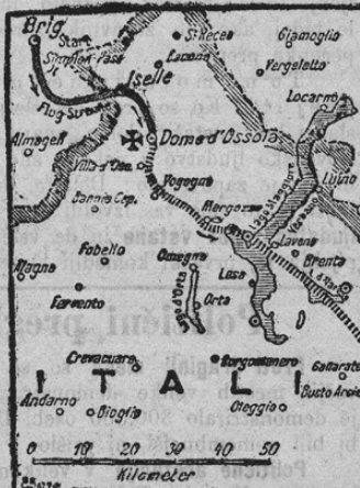
Der Aviatiker Chavez. Slika kaže na desni strani Chavez na svojem stroju, ne levi strani pa mali zemljevid, ki kaže kako je plovil. Kraj kjer je ponesrečil (Domo d' Ossola) označen je s križcem.

Zrakoplovstvo napreduje krasno. Seveda zahteva tudi mnogo žrtev. Te dni izvršil je južno-amerikanski zrakoplovec Chavez z svoj krasni polet čez Simplon. V 49 minutah je v zraku preplovil najnevarnejši del. Ali pri vasi Domo d' Ossola preobrnil se je zrakoplov in padel z nesrečnim iz grozovite višine navzdol. Chavez si je zlomil obe nogi in pridobil take notranje poškodbe, da je čez par dni umrl. Naša slika kaže na desni strani Chavez na svojem stroju, ne levi strani pa mali zemljevid, ki kaže kako je plovil. Kraj kjer je ponesrečil (Domo d' Ossola) označen je s križcem.