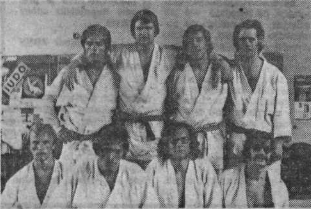
Ekipo Judo kluba Bežigrad, ki je zasedla prvo mesto v II. republiški ligi.