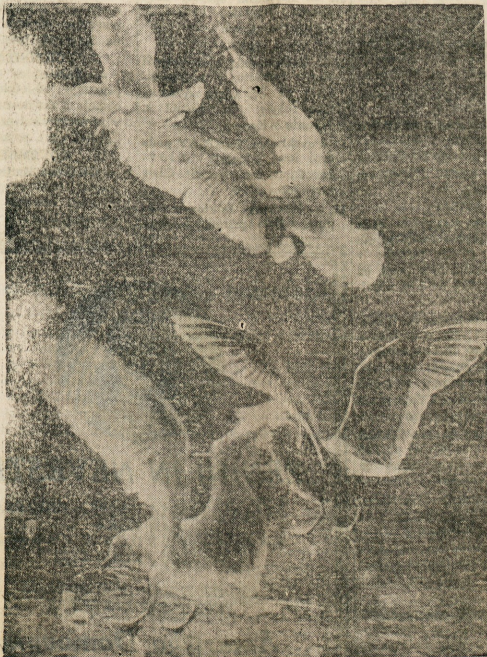
NENAVADEN PRISTANEK — Galebi so bili nekoliko iznemadeni, ko so zadel pri pristajanju na Mallard jezero pri San Franciscu na led namesto bi sedli v vodo. Nepričakovan vleder s severa je prinesel mráz in jezero je čez in čez zamrznilo.

IZDAJAMO TUDI ZDRAVILA ZA RACUN POMOČI DRŽAVE OHIO ZA OSTARELE St. Clair Ave. & 68th St.: EN 1-4212 AID FOR AGED PRESCRIPTIONS