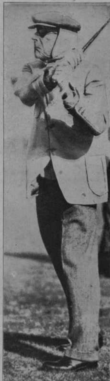
Rokefeler , najboga-tejši mož v Ame-riki je star že 91 let. Pravi, da je dosegel tako vi-soko starost le, ker je redno živel, mnogo delal in se gibal in malo spal (po štiri do pet ur na dan). Pred ne-davnim so časopisi prinesli vest, da na-merava svoje ogro-mno premoženje razdeliti tako, da bo prišlo v prid mi-lijonom potrebnih Igra vsak dan igro »golf«, ki je podobna naši pastirski igri »volk«. Kljub visoki starosti se rad zabava s tem športom.