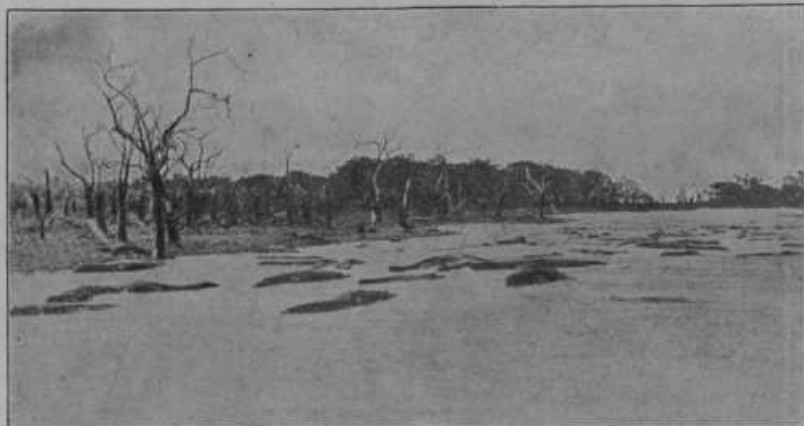
Iz vroče Afrike. Afrika je sicer že dobro preiskana in popisana, vendar dobimo malo slik od tam. Zato si je težko predstaviti, kaka so tisti kraji, kjer se čuje le rjo-venje in vpitje zveri, prečudno petje raznih ptičev, kjer čaka človeka na vsakem koraku grozna smrt. Je to za nas nekaj tajinstvenega. — Le pogledimo sliko gori: Velika reka Maraja z blatno in rumeno vodo je polna krokodilov in v prašumi ob njenih bregovih (slika doli) le s težavo pridobivajo kulturna tla z izsekavanjem.