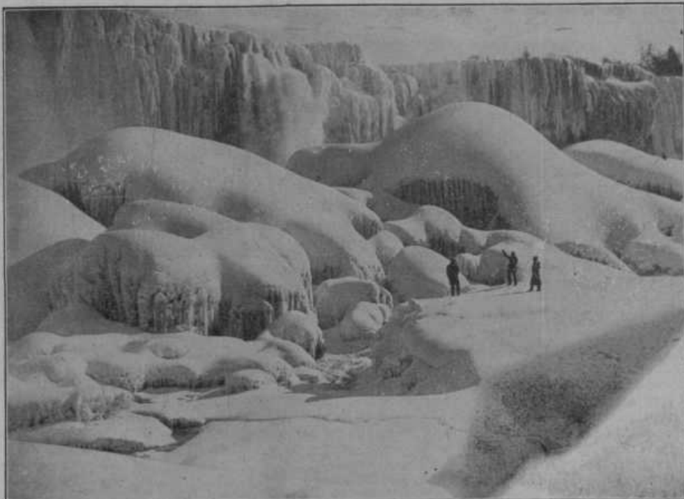
Niagarski slapovi , o katerih je pred nedavnim prinesel Slovenski Gospodar sliko, kako jih je videti poleti, so tudi letošnjo zimo zamrznili in nam nudijo jako veličastno zimsko sliko. — Pred enim mesecem, predno je nastopila huda zima, se je pri niagarskih slapovih odkrutila ogromna skala in se je s tem spremenila zunanja slika slapov.