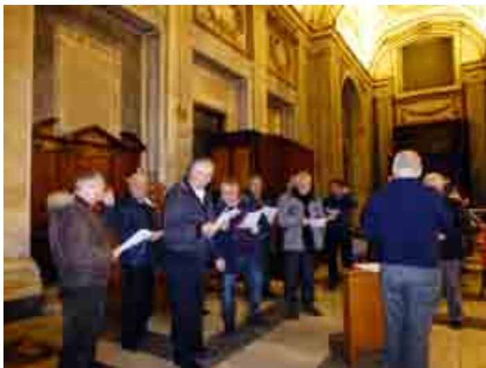
Vaja v baziliki Maria Maggiora