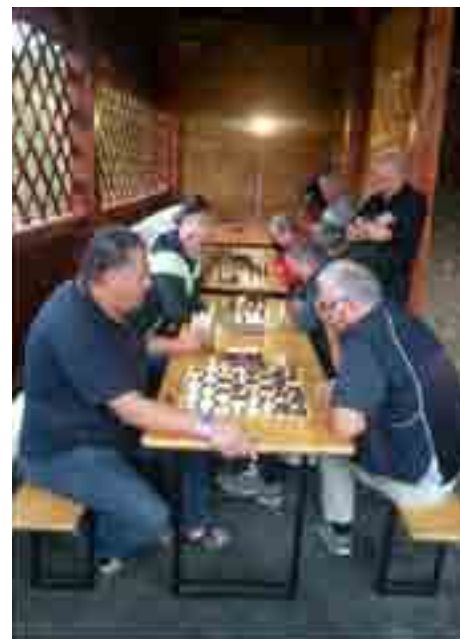
Dvoboji pod toplarjem