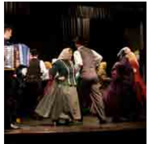
Folklorno društvo Lukovica