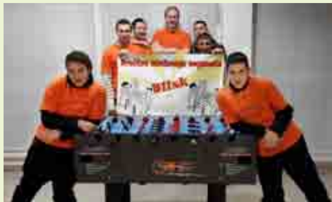
Člani kluba Blisk ob sprejemu Fireballa