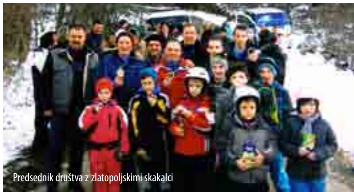
Predsednik društva z zlatopoljskimi skakalci