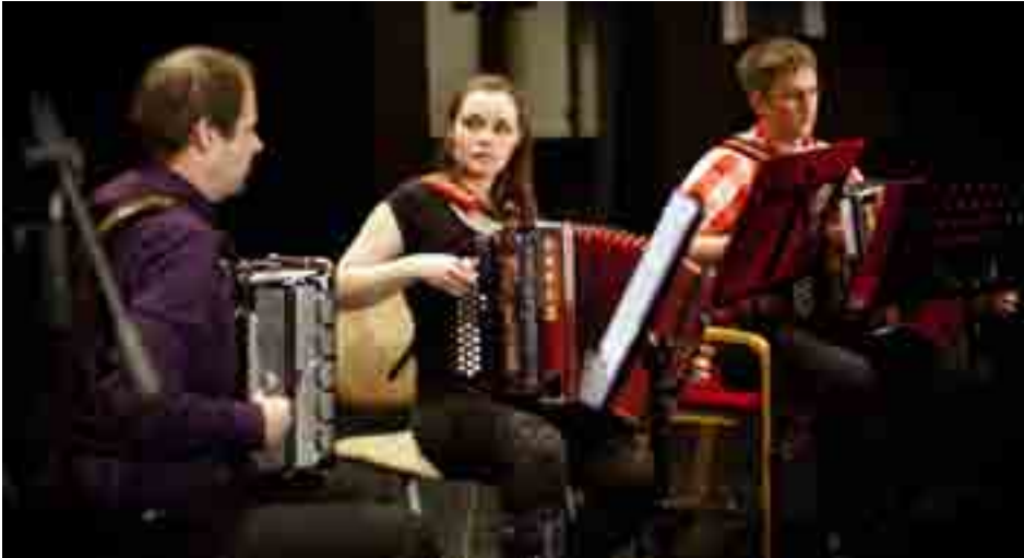
Trio harmonik glasbene šole Polton