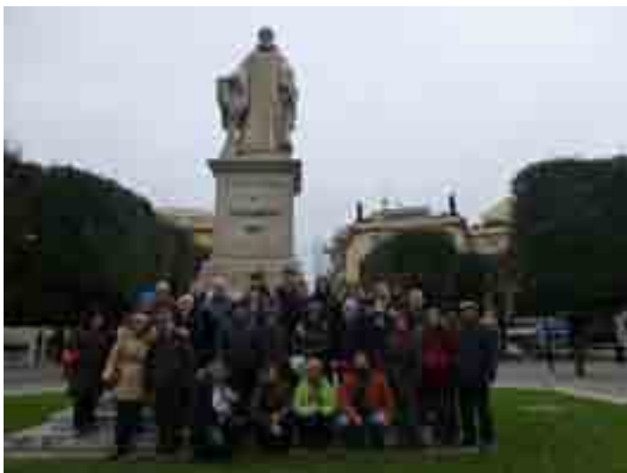
Pod kipom Gvida Monaca