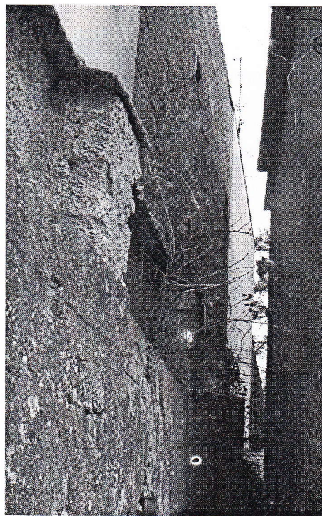
Sika 6: Del kamnitega mestnega obzidja zahodno od nekdanjih severovzhodnih vrat je danes ohranjen za zgradbo Ljudske univerze.

študentje sicer povzeli po drugih avtorjih, a dejstva niso mogla bistveno odstopati od realnosti, saj so med navedenimi tudi slušatelji s Spodnje Štajerske, po eden iz Žalca, Celja in Slovenske Bistrice ter dva iz Maribora. Ti so po vsej verjetnosti poznali realno stanje.