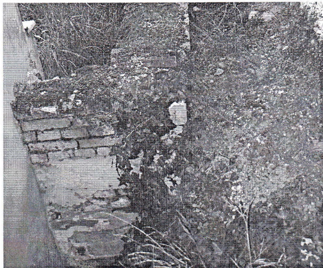
Sika 3: Del mestnega obzidja se je še ohranil zahodno od Heidenkumerjeve hiše, ki stoji na prazgodovinskem obrambnem nasipu oziroma severno od nekdanjih srednjeveških mestnih vrat. Pogled od juga proti severu.

jugovzhodu omejujejo diagonalno potekajoča deželna cesta in tri hiše južno od nje, na severu in zahodu pa prav tako nekaj zgradb. Sredi trikotnega dvorišča opazimo pravokoten znak modre barve s piko v sredini. Ker je enaka označba tudi v jugovzhodnem delu na notranjem grajskem dvorišču, hitro ugotovimo, da gre za označbo vodnjaka. V eni od bližnjih hiš pa je nekaj časa prebival obrtnik, ki je pri svojem delu nujno potreboval vodo, kovač namreč 14 , njega pa so potrebovali prevozniki, ki so se skozi »Platzertor« odpravljali ali na sever ali pa na vzhod.