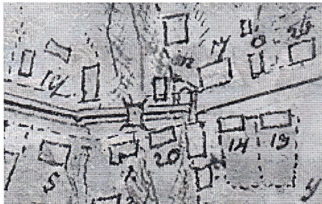
Slika 2: Ormož, izsek iz ledinske karte iz leta 1801. Zahodna mestna vrata so narisana kot obokan portal, z ravno lomljeno linijo pa je nakazan potek tranzitne ceste. Pravokotnik s podaljški v vogalih zahodno od mestnih vrat predstavlja po vsej verjetnosti most preko obrambnega jarka. Zemljevid hrani Občina Ormož. Fototeka Zgodovinskega arhiva Ptuj.

Dolžina ohranjenega zidu vzhodno od mestnih vrat znaša približno toliko kot stavba Ljudske univerze, oziroma kot na zemljevidu iz leta 1825 prikazana stavba. Od tu dalje lahko ugibamo. Če je imelo grajsko ozemlje tudi v tem predelu svoje zunanje obzidje, je moralo od tu slediti robu nekdanjega prazgodovinskega nasipa, ki ga danes prekinja cesta proti vzhodu, vendar to ne more biti notranje mestno obzidje, ki ga prikazuje Vischerjeva veduta. Mestno obzidje pa je po vsej verjetnosti od tu zavilo pravokotno proti jugu do vzhodnih vrat. Vprašanje pa je, katera so vzhodna mestna vrata. V virih so izpričana »Platzertor«, torej Trška vrata, tista, ki so vodila z vzhoda na Glavni (današnji Kerenčičev) trg. Curk jih predvideva nekaj vzhodneje od današnjega Kerenčičevega trga, tam, kjer je arhitekt Moškon z obokom preko ceste tudi nakazal lego nekdanjih mestnih vrat. Ta naj bi bila prikazana na Vischerjevi veduti, za njimi naj bi cesta vodila ali naravnost na vzhod do portala grajskega predgradja (to potem na bakrorezu ni vidno) ali pa je pred predgradjem ostro zavila na sever (današnji severni del Kolodvorske) kot nekakšen koridor med grajskim in mestnim delom, proti ogrskim vratom na severu.