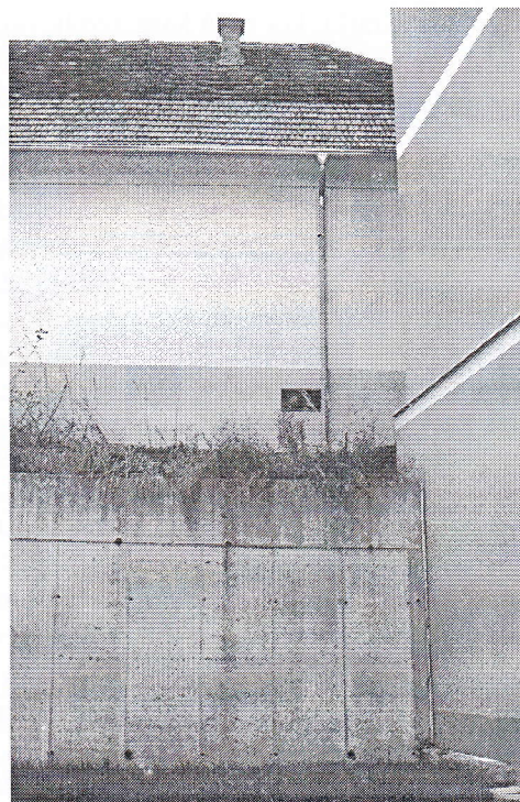
Sika 4: Del Heidenkumerjeve hiše, ki stoji na prazgodovinskem obrambnem nasipu. Ohranjeno srednjeveško obzidje zakriva danes v pogledu od zahoda proti vzhodu betonski zid.