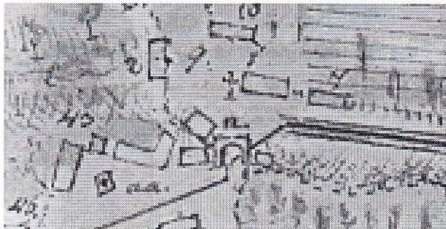
Slika 5: Severovzhodna mestna vrata so na zemljevidu iz leta 1801, narisana kot obokan portal.

različnih podatkov, ki jih dajeta oba do sedaj omenjena zemljevida oziroma načrta mesta. Na ledinski karti ormoške gosposčine iz leta 1801 so namreč še narisana mestna vrata, medtem ko jih na zemljevidu iz leta 1825 ni več videti. Toda upodobitve obokanih portalov iz leta 1801 so le blede senca stolpastih vrat z vedute iz leta 1681. To vprašanje je do neke mere rešila objava publikacije Slovenija na vojaškem zemljevidu 1763-1787. 16 Tu je na zemljevidu jasno viden polkrožni obod nekdanje prazgodovinske naselbine, v zahodnem delu je njegov obod pozidan s stavbami. Iz uvodnega dela publikacije zvedemo, da so meritve ozemlja današnje Slovenije potekale v letih 1784-1787, dela je vodil polkovnik Jeney, sekcija 197, v katero spada tudi Ormož, pa je kartiral in opisal nadporočnik Werthenpreis. Za nas je na tem mestu zanimiva predvsem njegova zaključna pripomba: »To mesto je bila nekdanj trdnjava, na katero spominjajo ostanki zidov in jarkov okoli tega malega mesta. Obvladujeta pa ga grajski hrib in hrib Dobrava (Dubrava). Jarki so zamočvirjeni.« Iz zapisa torej jasno izvedemo, da mesto že sredi osemdesetih let 18. stoletja ni imelo več uporabnega obzidja. Besedica nekdanj nam razkriva, da njegova rušitev ni bila ravno v bližnji preteklosti. Vendar najdemo zapis, ki omenja mestno obzidje še v prvi polovici 18. stoletja.