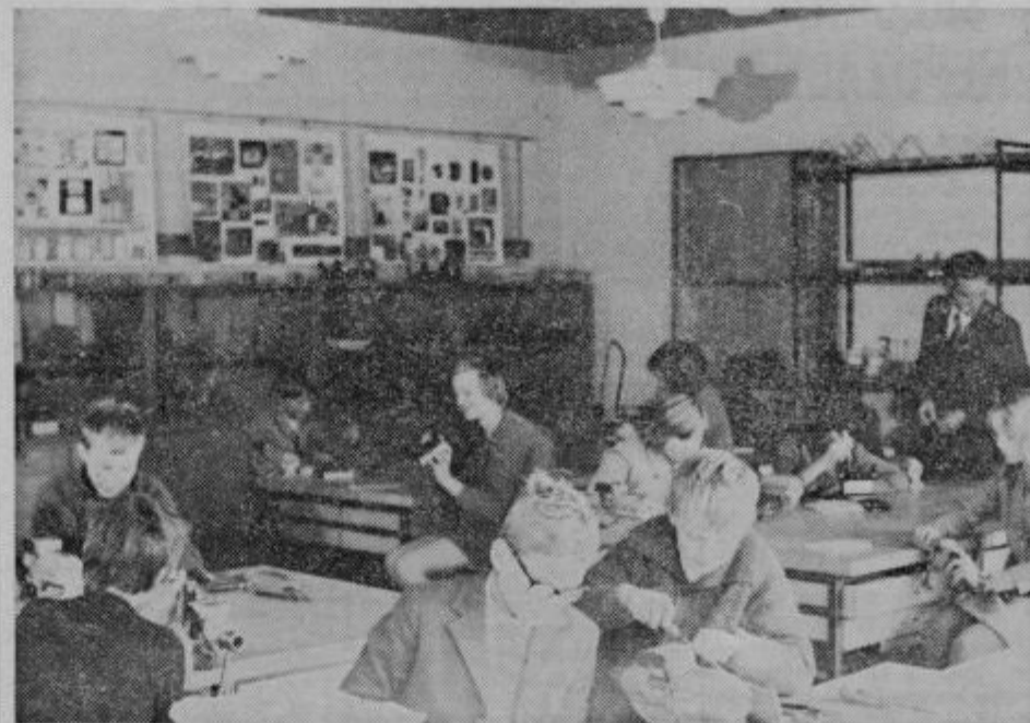
Učenci pri tehničnem pouku v improvizirani delavnici ...

Po pravilih medobčinskega sveta zveze sindikatov za osem občinskih sindikalnih svetov celjskega območja je sedež tega foruma vsakih šest mesecev v drugi občini. V tem času je predsednik občinskega sindikalnega sveta v tej občini tudi predsednik medobčinskega sveta. Prvi mandat po tem razporedu je imel občinski sindikalni svet Slovenske Konjice, in sicer od ustanovitve medobčinskega sveta zveze sindikatov v drugi polovici letošnjega marca do sredine oktobra. Kot drugi je prišel na vrsto občinski sindikalni svet Zalec. Glede na precejšnje sodelovanje sindikatov in sveta osmih občin je sedež obeh medobčinskih forumov hkrati v isti občini.