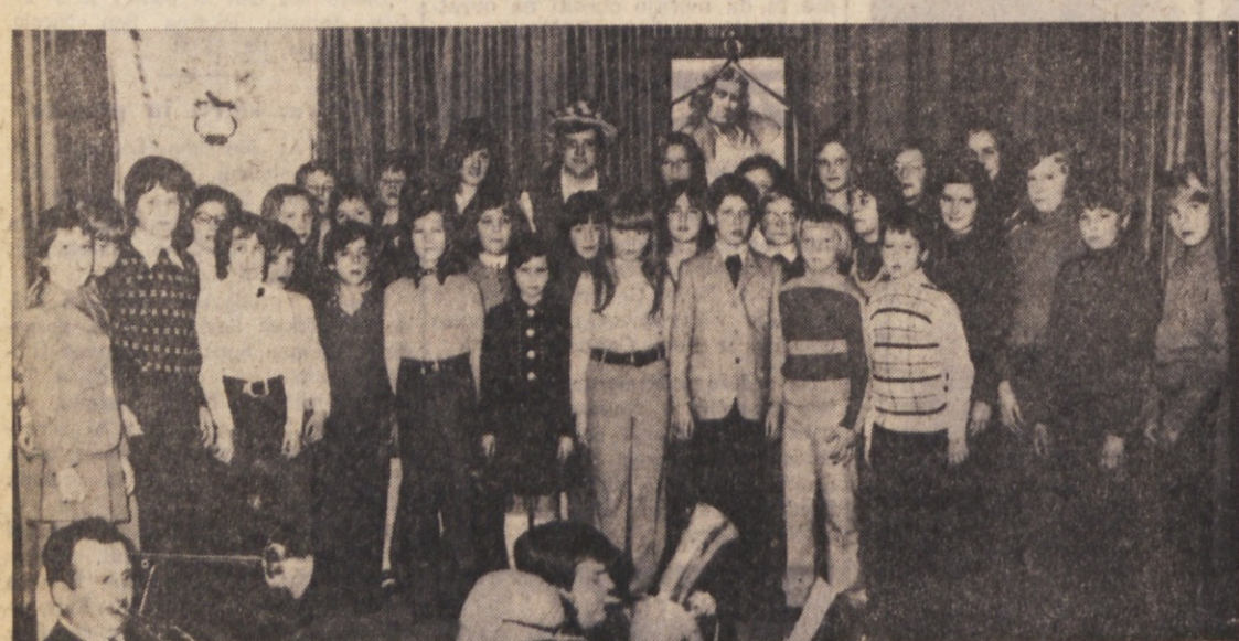
V soboto zvečer so slovenski kulturni praznik slavili tudi v Ricmanjih. Proslavo je pripravilo PD «Sla-vec» ob sodelovanju skoraj vse domače mladine