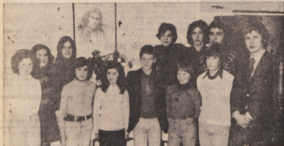
V Borštu so priredili Prešernovo proslavo v nedeljo popoldne. Program je pripravila borštanska mladina