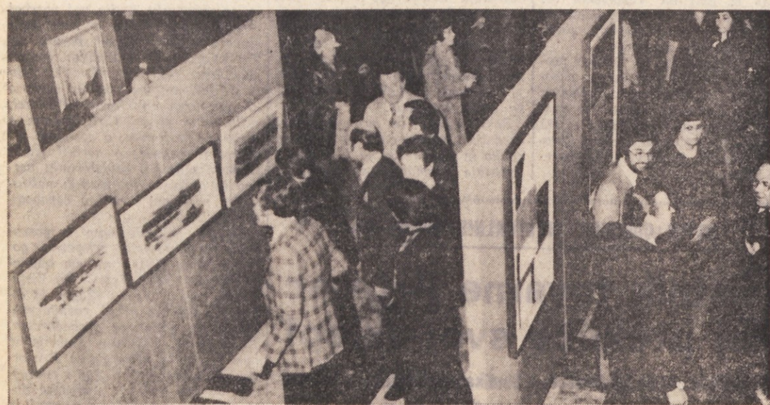
okviru osrednje Prešernove proslave je bila prirejena tudi slikarska razstava, na kateri sodeluje dvajset slovenskih slikarjev