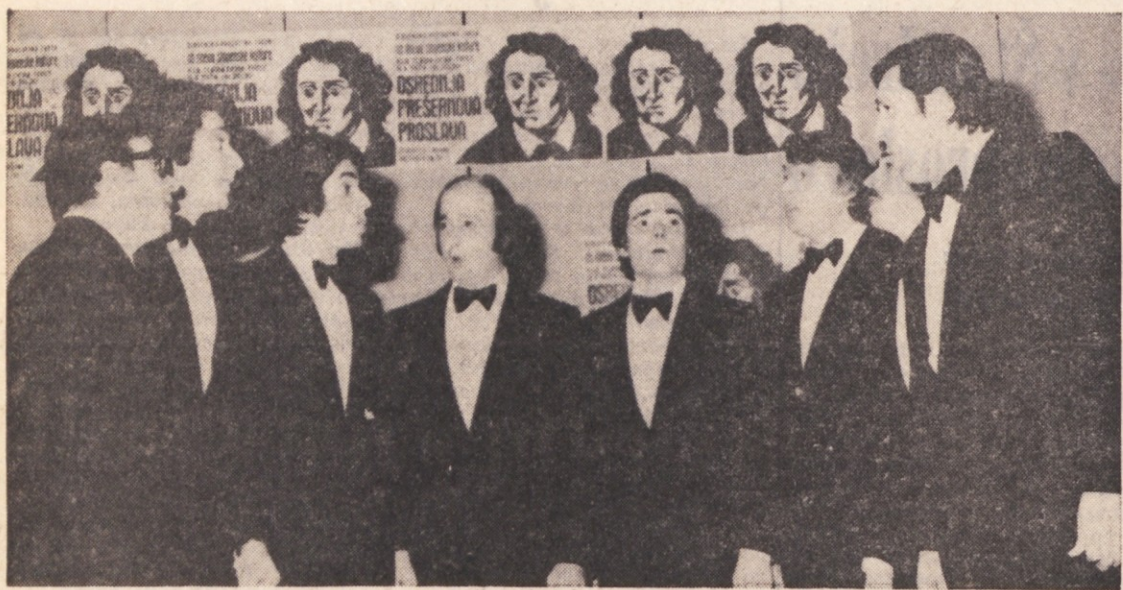
Na osrednji Prešernovi proslavi v Kulturnem domu je sodeloval tudi Tržaški ojekt