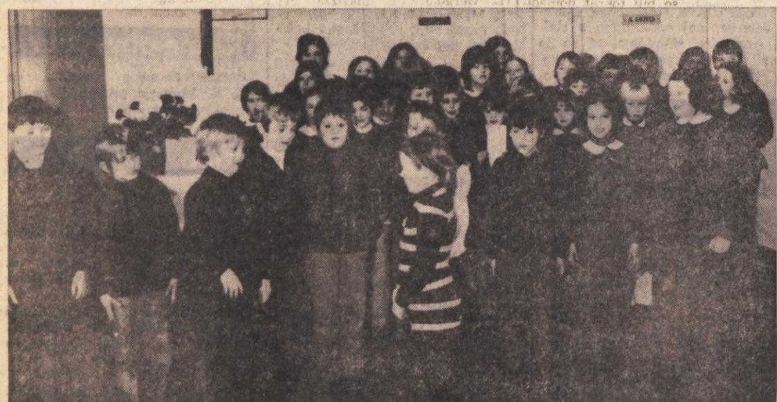
Prešernovo proslavo so imeli tudi na osnovni šoli v Dolini. Nastopili so šolarji vseh razredov