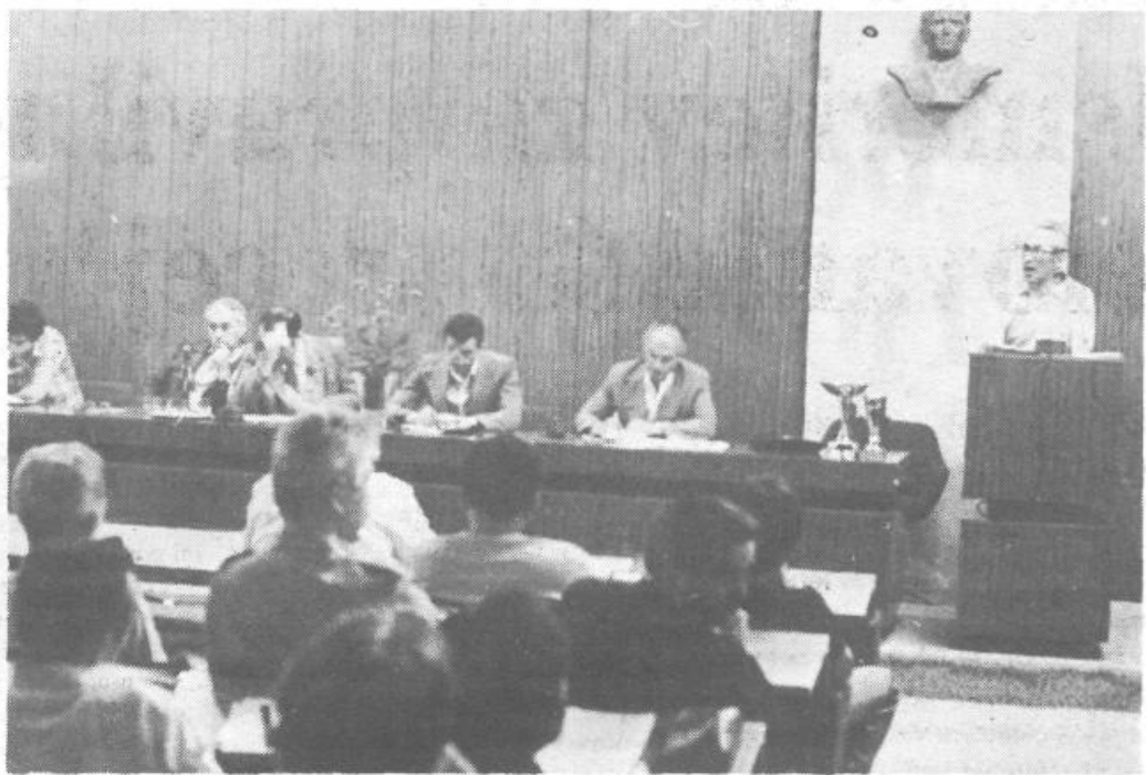
Z letne konference rezervnih vojaških starešin

Vrsta skupnih nastopov na mnogih tekmovanjih pa jih veže tudi z mladinci