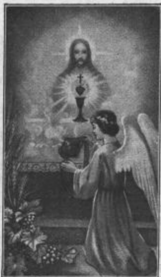
Jezušovo Srce v Oltarskom Sves-tvi, povnoži nam vero, vüpanje i lübezen! (300 odpüstka. — 1917. aprila 5.)

Pa Jezušovo Srce nema samo za düšo milošče i smilenja, ma je za vse potreboče naše, tudi za telovne. Ve smo pa mi njegova deca i on je naš oča, zato pa odpira svoje Srce nam, svojoj deci, skoz celo življenje vu vseh potrebočaj i nevolaj. Kak lepo nam to pokaže zgodba svetoga Pisma, ki nam jo naznanja sv. Janoš evangelist i apoštol vu svojem evangeliumi. Po Jezušovom goristanenji je bilo. Vučenicje so ribili celo noč i niedne ribice ne so zgrabili. Proti jütri se prikaže odičeni Jezuš na bregi.