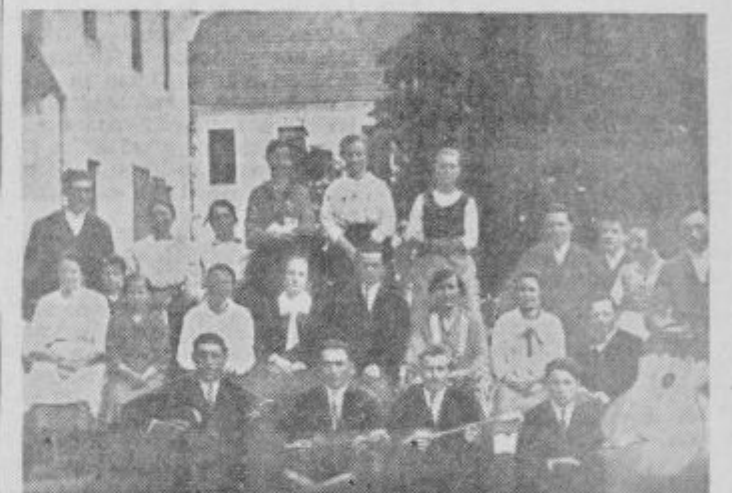
Leta 1925 so igrali neznano igro

Kot je bilo že poročano, bodo 28. t. m. (na predvečer praznika republike) na Borlu praznovati obletnico ustanovitve bralnega društva »Naprejš«. Priprave za ta veliki jubilej so v polnem teku. Stari dramske skupine vadijo odlomke iz štirih del — iz Finžgarjeve »Razvalina življenja«, Cankarjevega »Kralja na Betajnovi«, Linhartovega »Matička« in Nušičeve »Ministerce«. Orkester pridno vadi prav tako tudi dve tamburaški skupini. Društvo pripravlja ob tej priložnosti razstavo ohranjenih fotografij in ostalih dokumentov o delu društva in prosvetni dejavnosti v kraju. Poleg tega so obljubili mariborski in ptujski slikarji, da bodo ob času proslave priredili v šoli manjšo razstavo slikarskih del. Vrsni ljudje sestavljajo kroniko in ima že zbranega mnogo materiala. Tako je že znana večina imen starih pevcev in tamburašev ter igralcev. Društvo bo povabilo k sodelovanju vse bivše aktivne člane in je razposlalo vabila že tudi tistim, ki živijo po ostalih krajih Slovenije, da bi se na ta dan zbrali in obujali spomine. Da bi bila razstava čim popolnejša, še enkrat pozivamo vse, ki imajo kakšne slike, knjige s stampiljkami enega ali drugega društva, razne vloge, stare tamburice in podoben material,