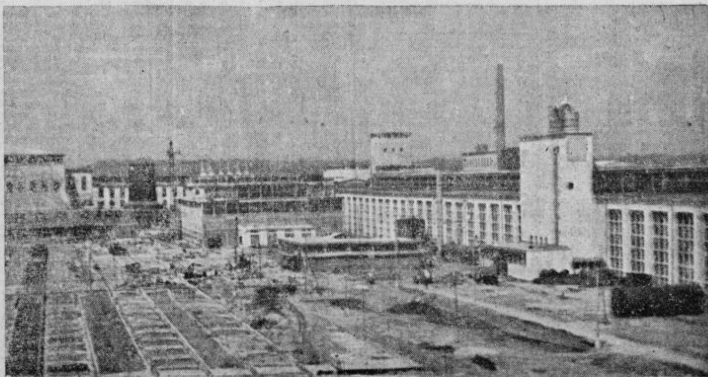
Kolektive in prebivalce iz ptujskega okraja vabimo, da se udeležijo slavnostne otvoritve tovarne glinice in aluminija, ki bo 21. novembra t. l. ob 10.30.

Kolektiv Tovarne glinice in aluminija Kidričevo