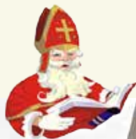
DKH Foto: TD Pivka

Na miklavžev večer, se je v središču Pivke, pred in v Krpanovem domu odvijal sedaj že tradicionalni pivški Miklavžev sejem. Priljubljen dogodek je privabil številne obiskovalce, saj je bila ponudba na stojnicah še kako privlačna in pestra. Turističnemu društvu Pivka, ki je na sejmu poskrbelo za tople napitke in praznično vzdušje, je uspelo k sodelovanju pritegniti kopico domačih obrtnikov, ustvarjalcev in umetnikov, ki so se predstavili z lepimi in zanimivimi, predvsem pa unikatnimi izdelki.