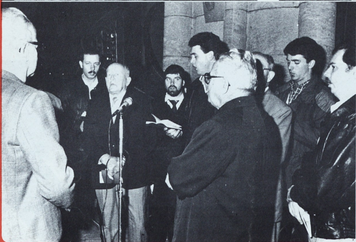
Del skupine pevcev, ki so vodili mogočno ljudsko petje na letošnjem lujanskem romanju.