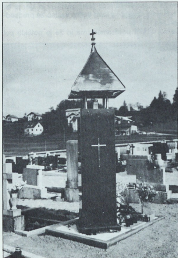
Št. Jurij pri Grosupljem. 24. oktobra 1992 so na pokopališču slovesno odkrili in blagoslovili spomenik zamočanim (pobitim od partizanov), ki so ga dali narediti in postaviti svojci žrtev.

Slovenska vojska, ki počiva v Rogu, na Teharjah in po vsej Sloveniji, nam je zato porok.