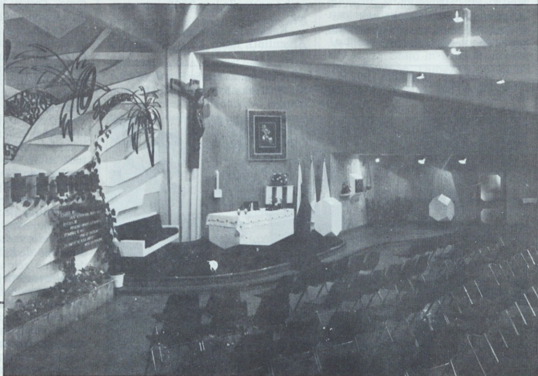
Cerkev Marije Pomagaj v Slovenski hiši

K poglobljanju verskega življenja so poleg rednega dela duhovnikov in zvestih laikov pripomogli še številni