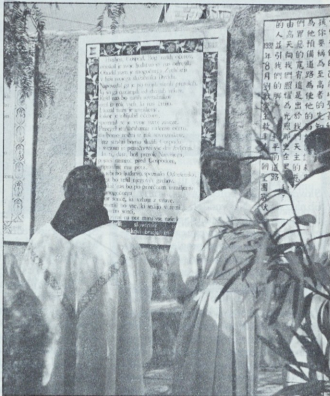
Ain Karem, Sveta dežela. — Blagoslovitev plošče z Zaharijevim slavospevom v slovenščini. — Foto: Mirjam OBLAK

Vprašanj, ki jih je treba reševati, je veliko: ureditev pravnega položaja katoliške Cerkve v slovenski državi, vračanje zaplenjenega cerkvenega premoženja, plačevanje davkov duhovnikov, redovnikov in redovnic, vsaj simbolna povrnitev škode za toliko porušenih cerkva po revoluciji, vprašanje šolstva itn.