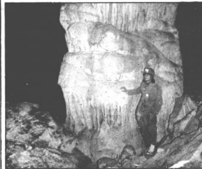
Ledeni kapnik v jami na Raduhi