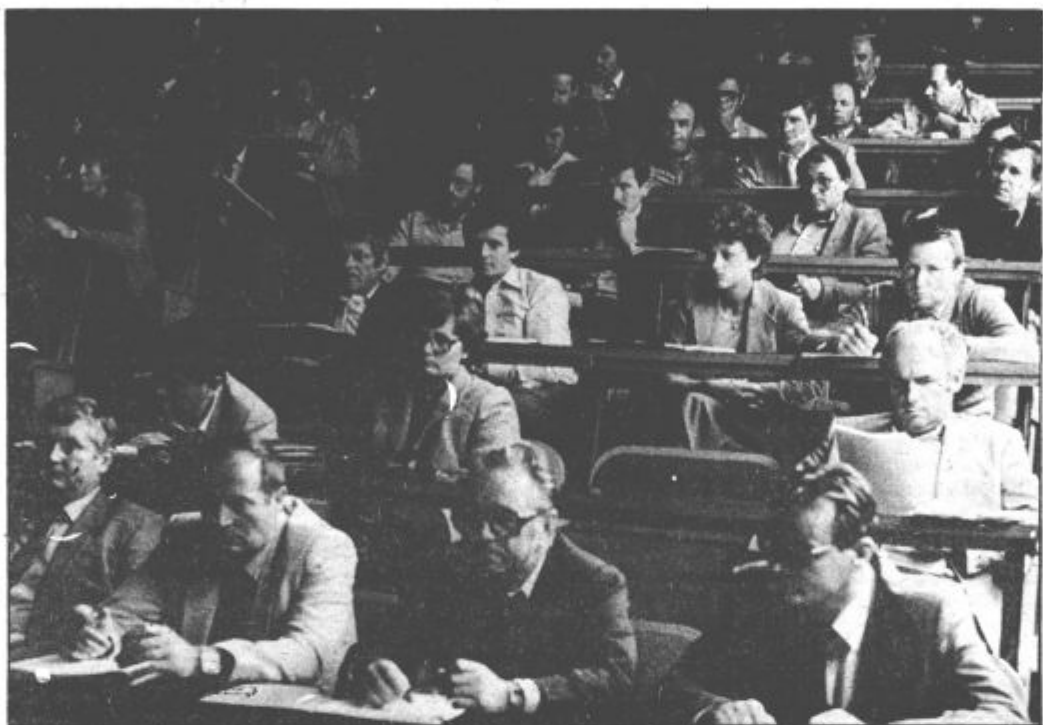
Akcijska konferenca je ugotovila, da niso vprašljivi cilji združevanja v sozd Gorenje oziroma samo združevanje!