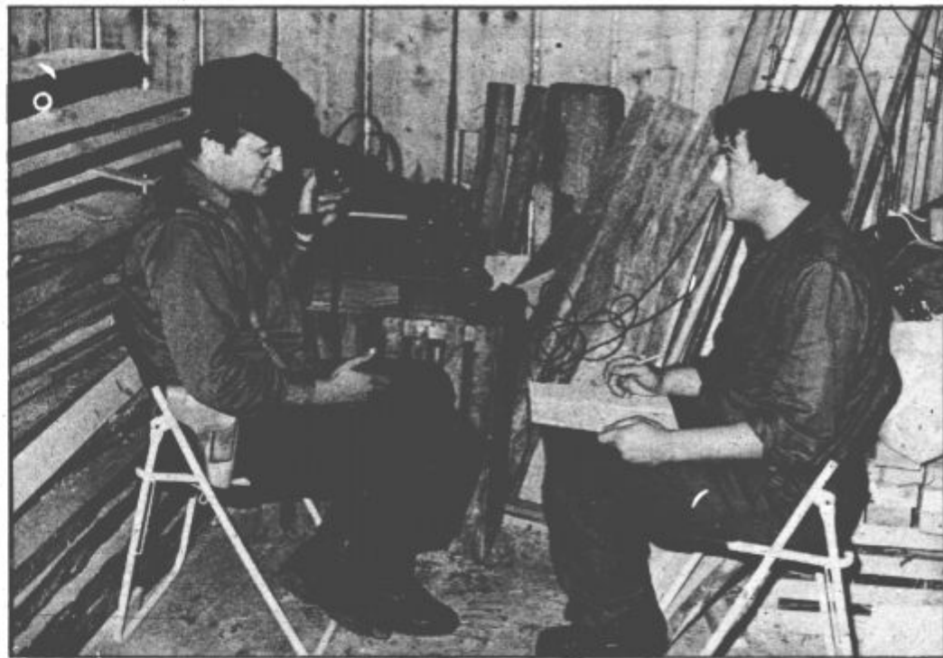
Naši vezisti so potrdili dobro usposobljenost (sv)

„Reči moram, da je občinski center zvez dobro in sodobno opremljen,“ je povedal vodja centra