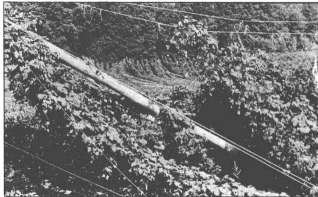
Neurje preprečilo še boljši pridelek