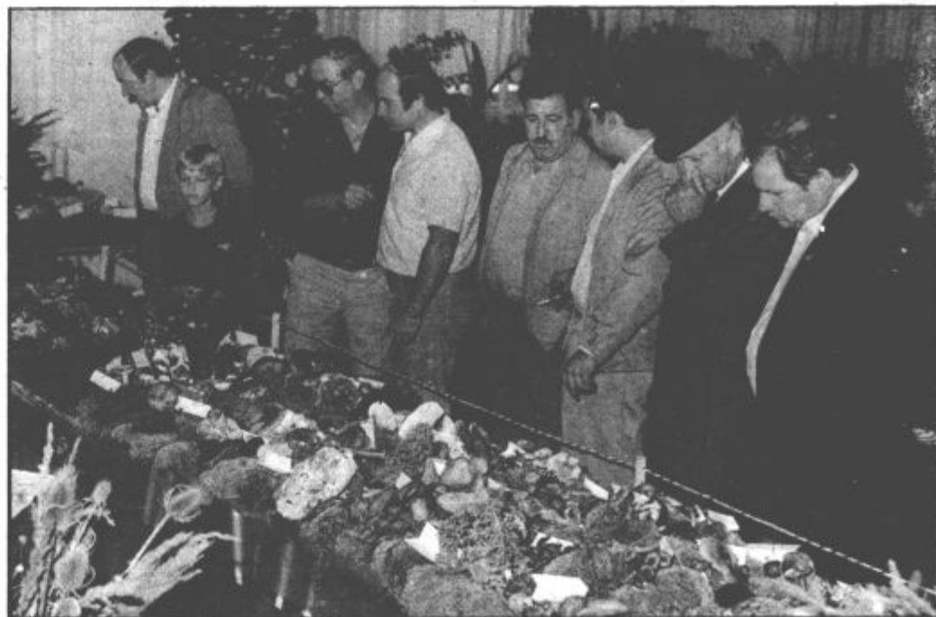
V počastitev krajevnega praznika so v Šoštanju pripravili zanimivo razstavo gob in cvetja.

Kljub temu, da so nekateri prvič prišli za kiparsko dletev in kladivo, so naredili zares lepe kipe.