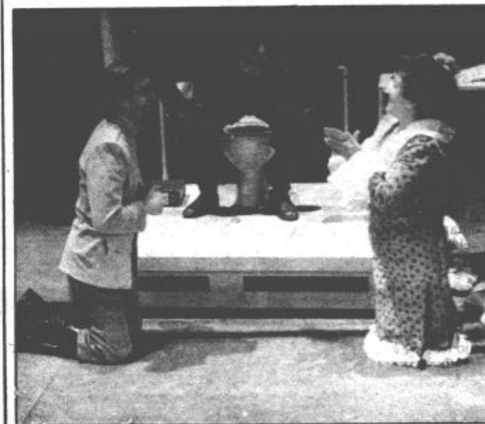
S „sekiro“ tudi v tujini