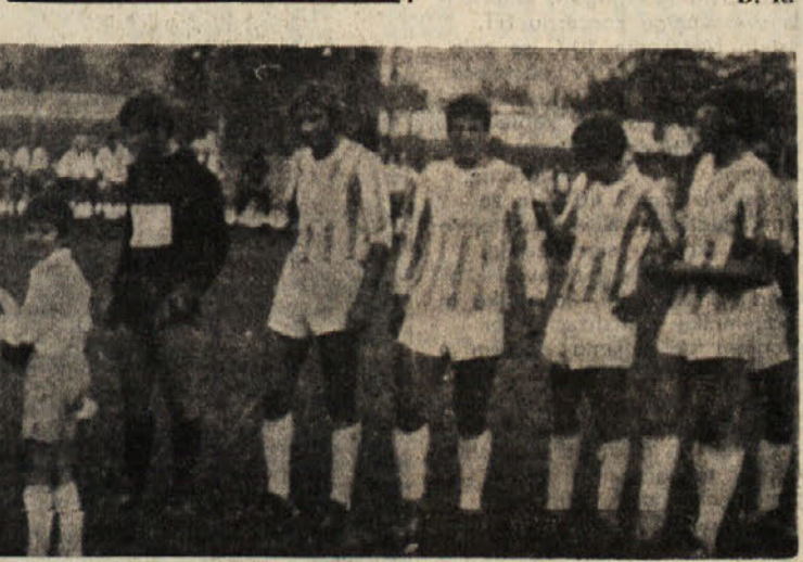
Iszmenjava daril med Adrio iz Mirna in Sovodnjami pred nogometno tekmo za «Turnir prijateljstva»

Proti koncu aprila pa je pričel ponovno intenzivno trenirati pod nadzorstvom prijatelja ter trenerja Silvestra in njegov disk je ponovno čisto letel preko 58 metrov. Konec preteklega meseca je Pečar zaključil študij drugega letnika in pred prihodom v domovino je imel v Zruženih državah Amerike še zadnja dva nastopa. Najprej je na dnevnem daril med Adrio iz Mirna in Sovodnjami pred nogometno tekmo za «Turnir prijateljstva»