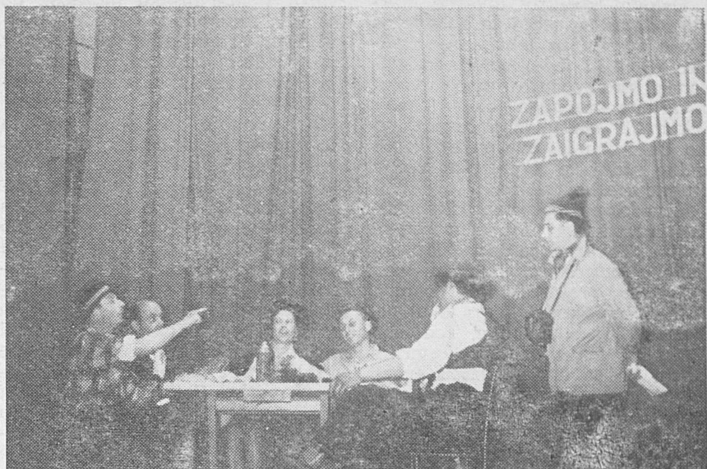
Pevski zbor v Cerknici prireja tudi zabavne skeče.

Na splošno ugotavljamo, da je zainteresiranost političnih in gospodarskih organizacij za naše prosvetno delo precejšnja. Tako se danes v imenu pevske instrumentalne sekcije zahvaljujem za razumevanje in materialno pomoč predvsem SZDL Cerknica in Sindikalni organizaciji Lesnoindustrijskega kombinata »Brest« Cerknica. Slednja nudi vso pomoč in podporo pevcem, zaposlenim v podjetju.