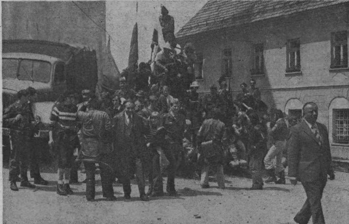
Na Svetem Gregorju se je pohodna enota srečala s pripadniki teritorialne enote — sledil je spominski posnetek