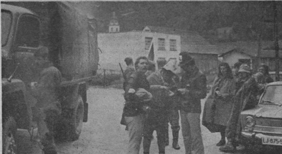
Sodražica, v dežju, kjer se je mladinska pohodna enota pričela vzpenjati na Travno goro