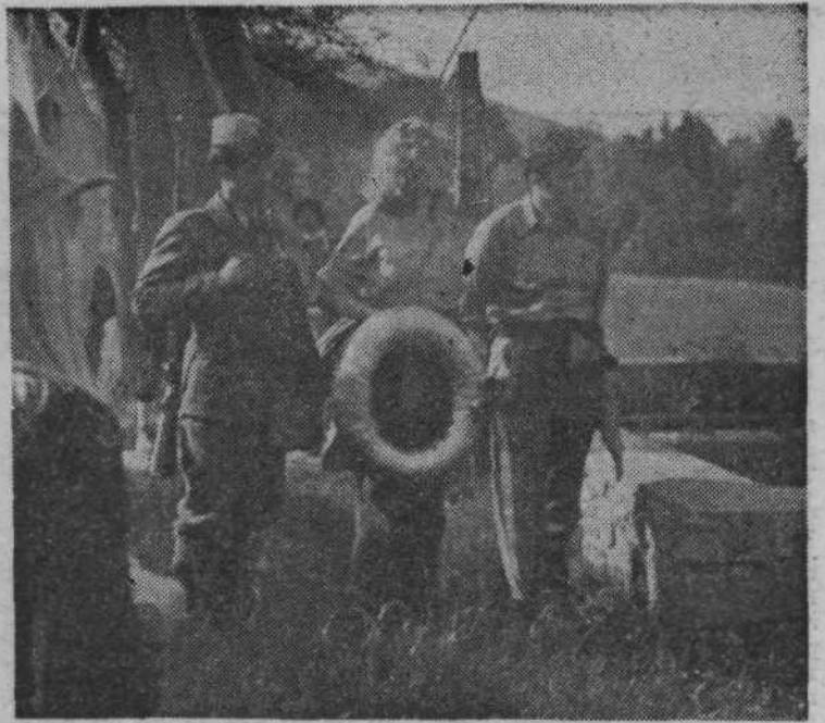
Ob spomenikih, ki jih je pohodna enota srečala na svoji poti, so mladinci in vojaki počastili padle z enominutnim molkom in položili vence

Od Travnice gore do Ljubljane prav dolge so poti, kljub temu smo pogumno jih prehodili mi.