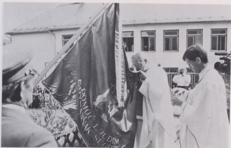
Osrednja prireditev letošnjih Porabskih dnevov je bila 23. maja na Gorenjem Seniku. Dopoldanskemu delu, dvojezični sv. maši in blagoslovitvi gasilskega praporja, je popoldne sledil kulturni in športni del.