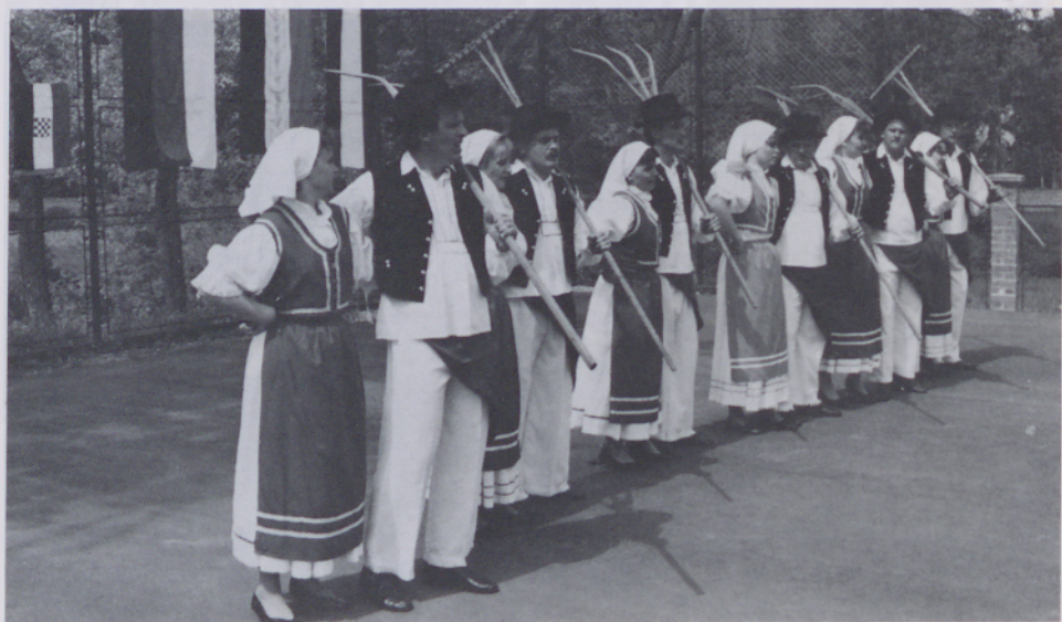
V minulem letu je bilo veliko prireditev v Porabju in zunaj njega, na katerih so sodelovale različne kulturne skupine. Teh je v Porabju kar precej, od lutkarjev do cerkvenih in svetnih pevskih skupin. Folklorna skupina z Gorenjega Senika je 9. maja nastopila v domači vasi na srečanju članov Rdečega križa štirih sosednjih držav.