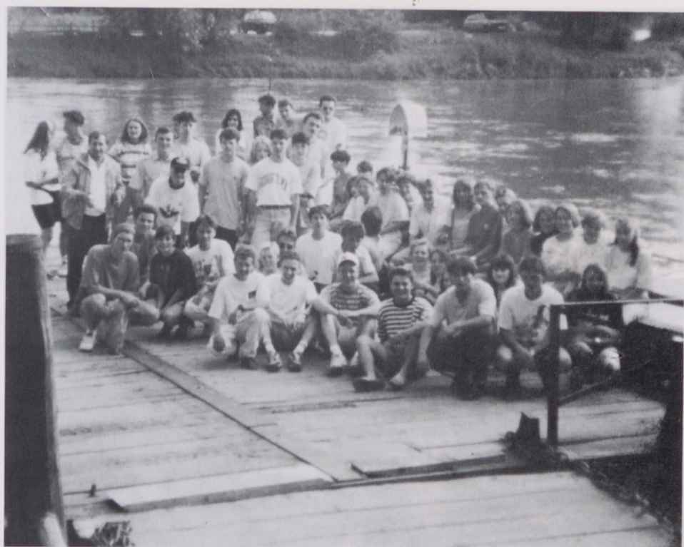
Mladina iz Berlina, Stuttgarta in Bogojine pri hotiškem brodu

Finžgarjeve Razvaline življenja, ki so jo predočili igralci iz Žižkov, razstava cvetja; ocenjevanje vina; obisk ministra Peterleta; blagoslovitev temeljnega kamna za novo telovadnico in novih veroučnih prostorov v Bogojini ter nove mrliške vežice v Filovcih, so dogodki, ki so ponujali kulturno in duhovno bogatitev.