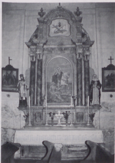
Stranski oltar sv. Martina