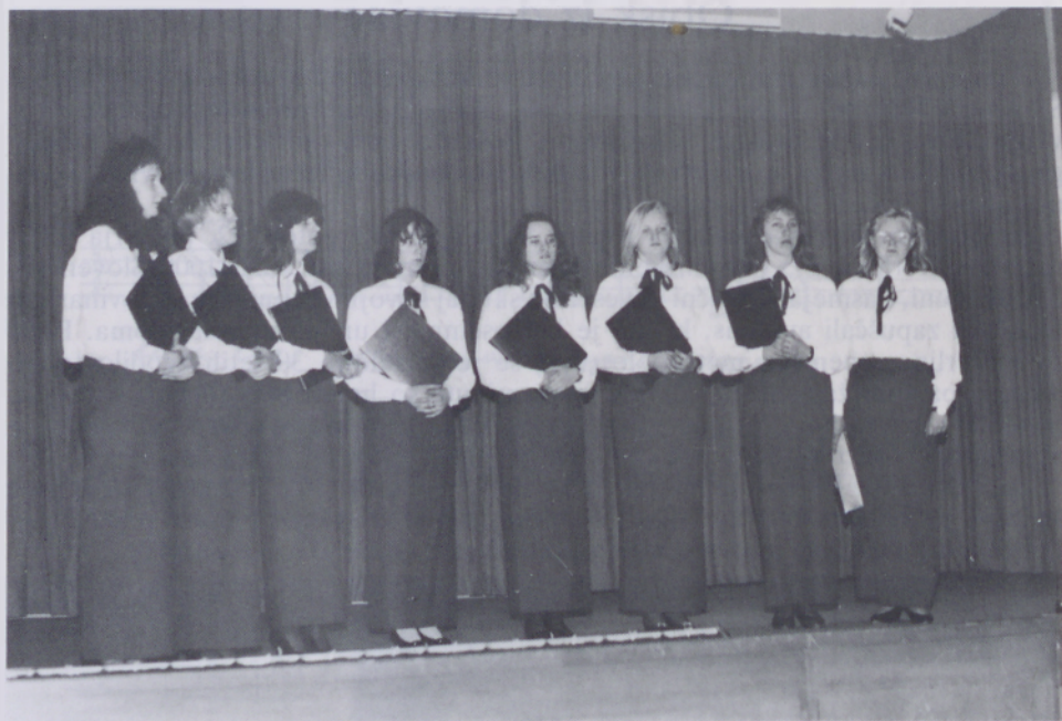
Dekliški oktet Talita iz Bogojine

V soboto, 23. januarja, je bil na programu ogled mesta, nakupovanje, obisk društva »Slovenija«, koncert skupine Talita-deklica in ogled »berlinskega podzemlja«. Za vse nas v Berlinu je bil vrhunec sobotnega večera koncert okteta Talita. Pozdrav napovedovalke je bil pozdrav vse Slovenije vsem Slovencem in gostom: »Slišim te, 'mami', kako šelestijo dolensjske lipe, kako valovi poljubljajo obalo