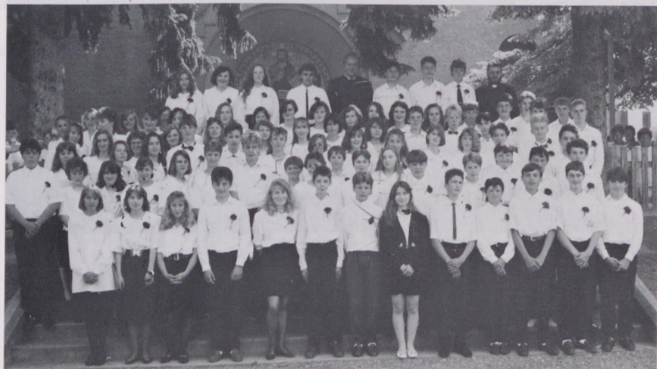
Izpoved vere 88 osmošolcev

Posebej smo se redno mesečno srečevali z ŽPS. Tudi skupina Karitas je naredila nekaj korakov naprej. V okviru župnijske Karitas smo organizirali dve dobrodelni akciji za begunce iz Bosne in v Bosni (Brčko). Posebno skrb pa so si mladi člani župnijske Karitas zadali za pripravo na zakramente naših romskih otrok. Zelo uspešno so jih pripravili in skupaj s 60 drugimi našimi prvoobhajanci na Binkošti