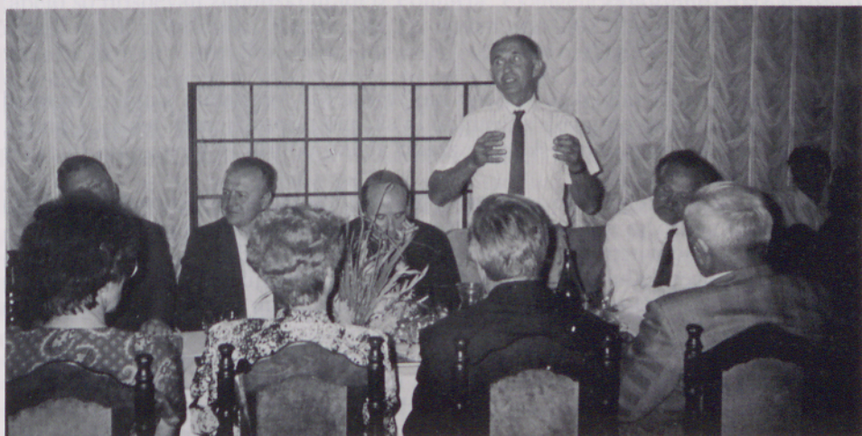
Gostje ob 600 letnici v Martjancih