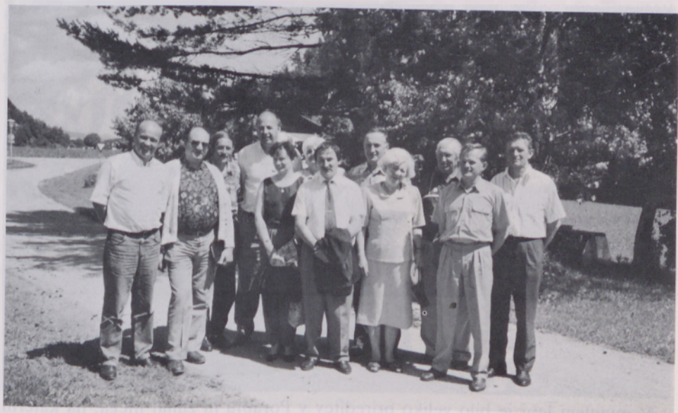
Vodstvo Porabskih Slovencev navezuje stike tudi z drugimi slovenskimi manjšinami, da bi boljše spoznali pot in možnosti za svoje preživetje. 17. in 18. junija se je delegacija Zveze Slovencev srečala s predstavniki Narodnega sveta na Koroškem.