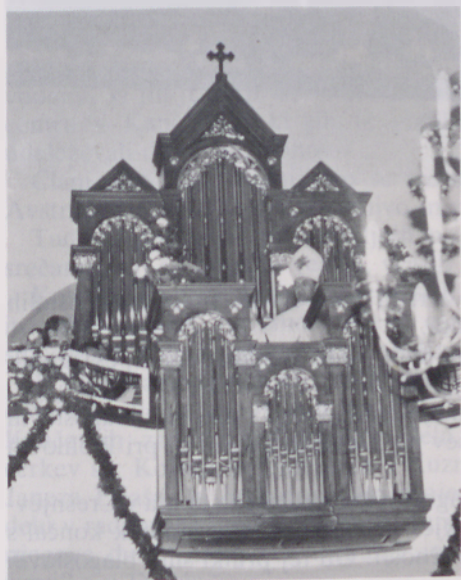
Blagoslovitev novih orgel

V sklopu obhajanja stoletnice posvetitve naše cerkve smo izdali posebno brošuro o zgodovini naše župnije.