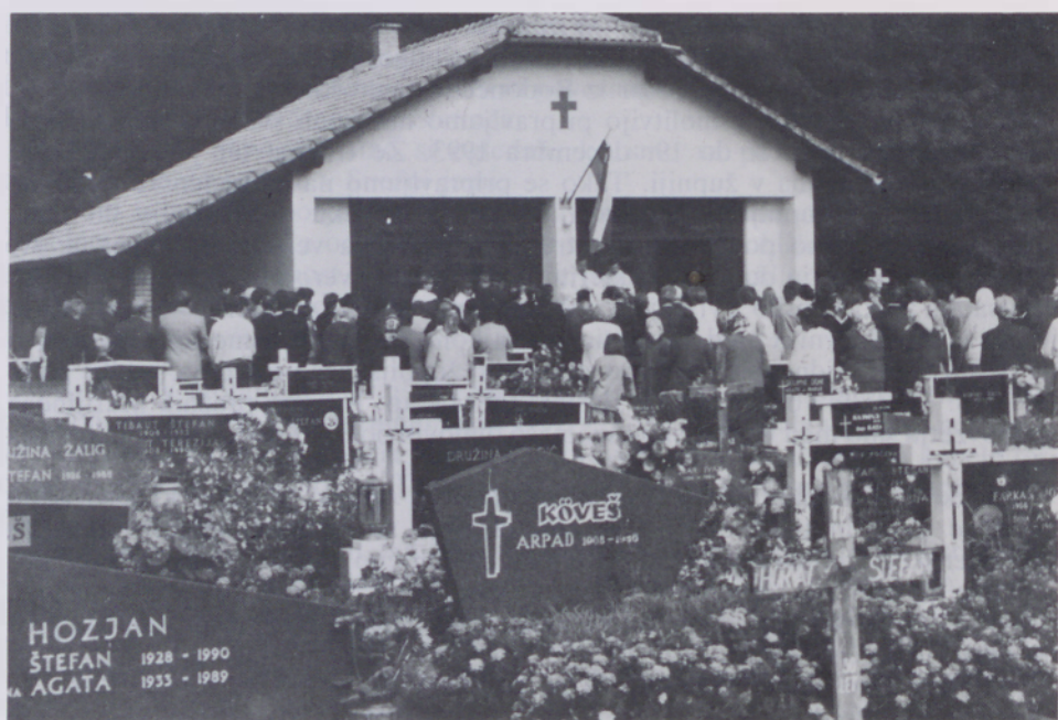
Mrliška veža na Hotizi