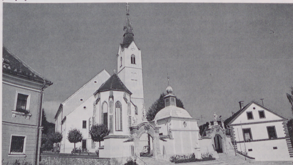
Obnovljena cerkev v Ljutomeru

Leta 1990 so celotno notranjost prepleskali, freske pa osvežili. Dela je vodil Drago Ficko. Tudi zunanjo fasado so skozi zgodovino večkrat obnavljali, nazadnje leta 1993. Pri zadnji obnovi fasade je sodelovalo več podjetij. Mogočno konstrukcijo odrov je sestavilo podjetje Lota iz Pesnice, pleskarska dela pa pod strokovnim nadzorom Zavoda za varstvo naravne in kulturne dediščine iz Maribora izvedlo podjetje Škraban iz Murske Sobote.