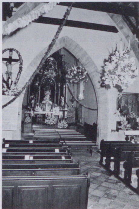
Slovesno okrašena cerkev pri Gradu

Pastoralno delo v župniji poteka normalno in versko življenje po ustaljenih oblikah. So tudi izjeme, ki nam pomagajo poglobljati duhovno življenje. Za mnoge je bilo lepo doživetje, ko so gasilci pri Gradu ob 70 letnici svojega društva, ki so ga obhajali 20. septembra 1992, ter prav tako gasilci v Vidoncih, ki so 18. julija 1993 obhajali 60 letnico svojega društva, vključili daritev sv. maše v program svojega praznovanja. Možje v uniformah, gostje in domačini, so sodelovali pri sv. maši, ki je bila v obeh primerih pri gasilskem domu. Po sv. maši je sledil kulturni program in veselo rajanje. Pri Gradu je ob tej priložnosti bil blagoslovljen tudi temeljni kamen nove gasilske dvorane pri gasilskem domu. Ekumenska slovesnost