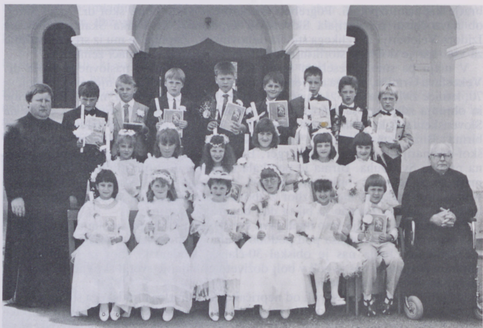
Prvoobhajanci pri Sv. Juriju v Prekmurju