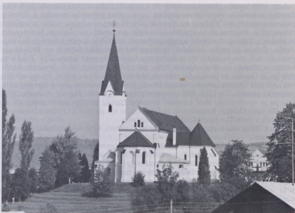
Župnijska cerkev sv. Jurija v Prekmurju

ladja je dolga 23,30 m in široka 9 m. Na desni in levi glavne ladje sta s stebri ločeni dve stranski ladjici, široki 2,5 m. Glavna ladja je visoka 12,30 m, stranski pa 6,10 m. Strop je obok, ki je poslikan s svetopisemsko tematiko. V prezbitერიju na levi in desni sta freski Kalvarija in Poslednja sodba. Cerkev je poslikal Franc Horvat iz Maribora. Oltarji so trije, v starem prezbitერიju, glavni oltar, ki je delo Tomana Feliksa iz Ljubljane in Marijin oltar, ki je bil postavljen v Marijinem letu 1954, delo kiparja Antona Blatnika iz Maribora.