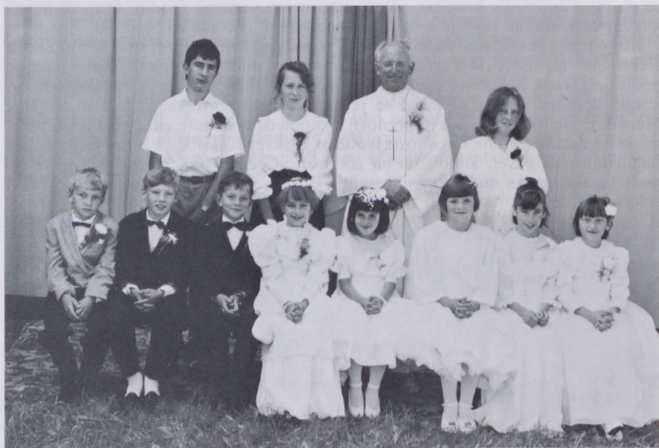
Prvoobhajanci v Pečarovcih

Čeprav naša cerkev ni velika, smo jo dali v juniju pred prvim obhajilom ozvočiti, da boljše slišimo tudi bralce beril in nežne otroške glasove, ko tudi ti nastopajo. Prav tako tudi tisti »boječci«, ki se radi ustavljajo pred cerkvenimi vrati.