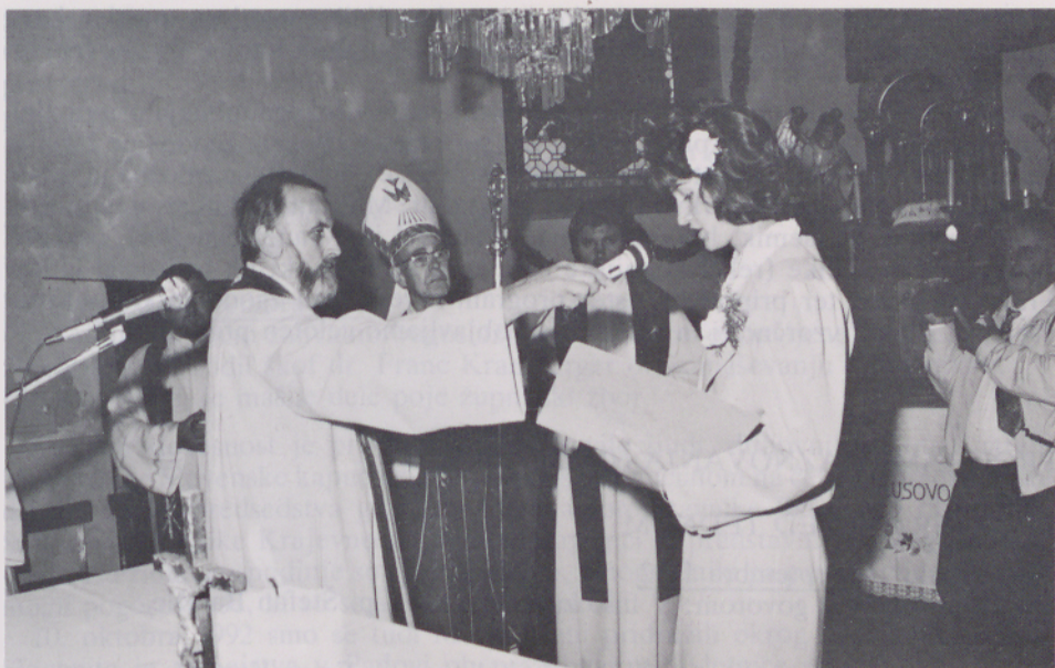
Birma v Markovcih

okrašeni cerkvi in ob ubranem petju domačega pevskega zbora smo vsi zbrani doživljali prve binškosti.