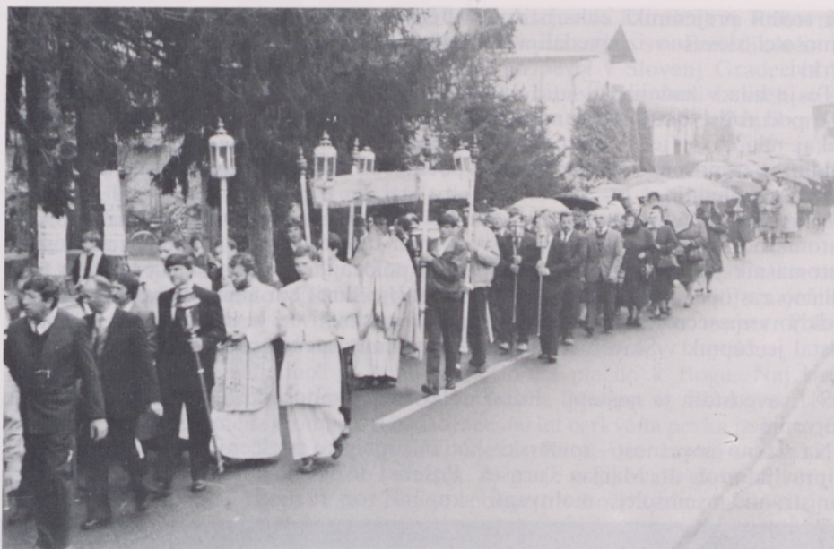
Velikonočna procesija v Turnišču

Obisk nedeljske maše nekaj čez 2.200, dobrih 100 jih »moli« zunaj cerkve.