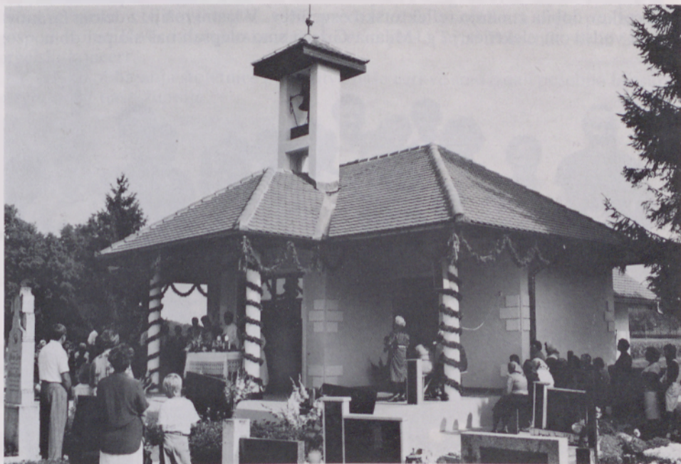
Kapela s pokopališko vežo