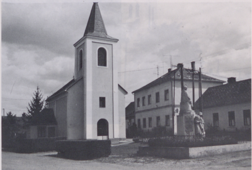
Kapela v Slovenski vesi