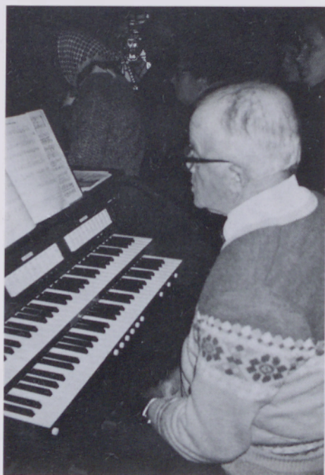
Nove elektronske orgle na Kobilju

Dva tedna za temi pevci so nas obiskali pevci iz Martjanec, ki so prav tako prepevali med mašo.