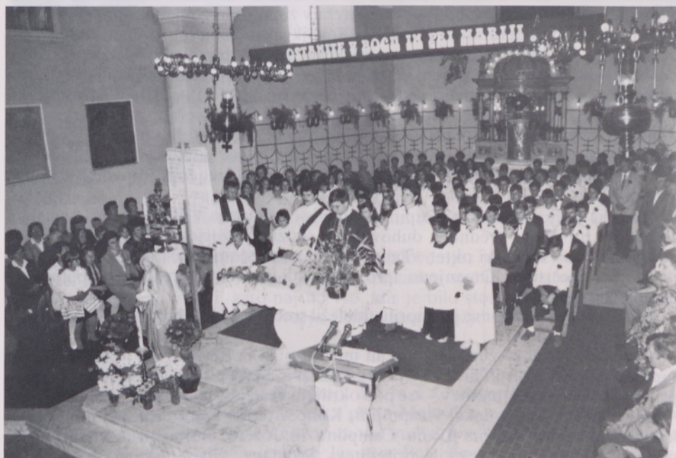
Izpoved vere 82 fantov in deklet

V mesecu maju je poleg starejših prihajalo tudi okrog 400 otrok in mladine k šmarnicam v župnijsko cerkev in v vaške kapele. Mladina in otroci tudi vodijo šmarnice po kapelah. Šmarnicam z naslovom z Marijo in Jezusom v novo tisočletje so otroci, mladina in starejši radi prisluhnili, saj so bile pisane v ljudskem stilu.