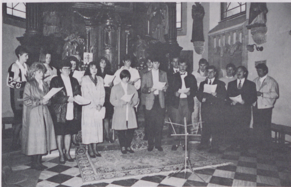
Cerkveni mešani pevski zbor