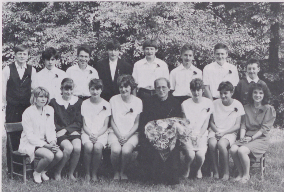
Izpoved vere na Pertoči

PERTOČA – Po globoko doživetem misijonu v adventu 1992 smo naslednje leto (torej 93) skušali preživeti v duhu misijona. Težko je izmeriti zagon, vendar ga nekateri podatki in dogodki potrjujejo. Najbolj smo ga občutili pri otrocih. Od nižjih do višjih razredov verouka so bili vsi prežeti z veliko zavzetostjo. Obisk verouka in sodelovanje pri njem je bil na izjemni ravni. Tudi pri osmem razredu neopravičenih izostankov ni bilo. Vseh petnajst osmošolcev se je na Pertoči in v Gerlincih redno pripravljalo na življenje odraslega kristjana. Ne le v teoriji, ampak tudi praktično. Vsi so se vključevali v branje beril, pasijona na cvetno nedeljo in drugih besedil. Tri dekleta izmed njih so obdarovana s pevskim poslušom, kar je velik božji dar. Že dve leti prepevajo v mladinskem zboru. Dva izmed fantov sta