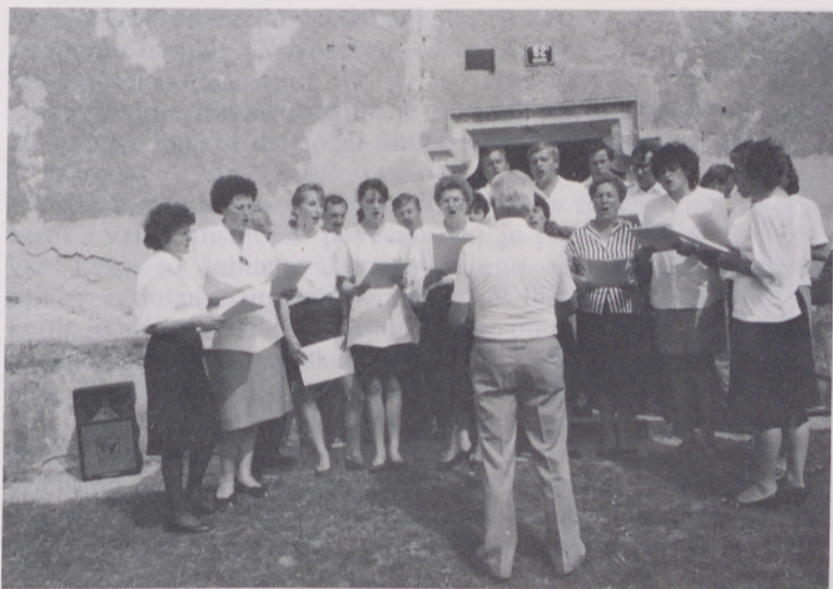
Martijanski pevci v Boreči

MURSKA SOBOTA – Utrip verskega življenja je v naši župniji pester in zanimiv. Krščenih je bilo 172 otrok, cerkveno pokopanih je bilo 119 oseb, poročilo se je 72 parov.