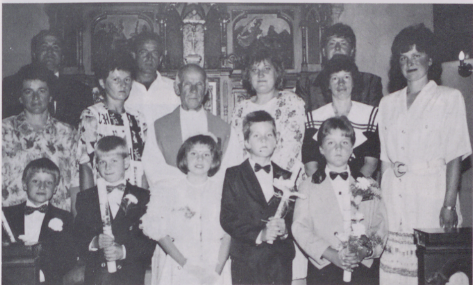
Prvoobhajanci s straši pri Nedeli

Od ponedeljka 6. septembra je v Martinju položen asfalt od glavne ceste navzdol okoli gasilskega doma in mimo kapele do »Kovačinih«.