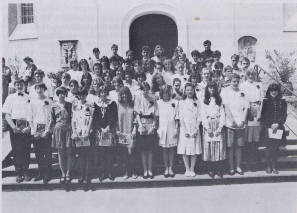
Osmošolci ob izpovedi vere

Osmošolci so ob zaključku verouka slovesno izpovedali vero in obljubili zvestobo Kristusu in Cerkvi.