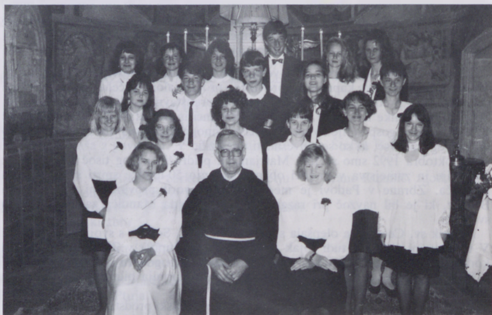
Izpoved vere osmošolcev