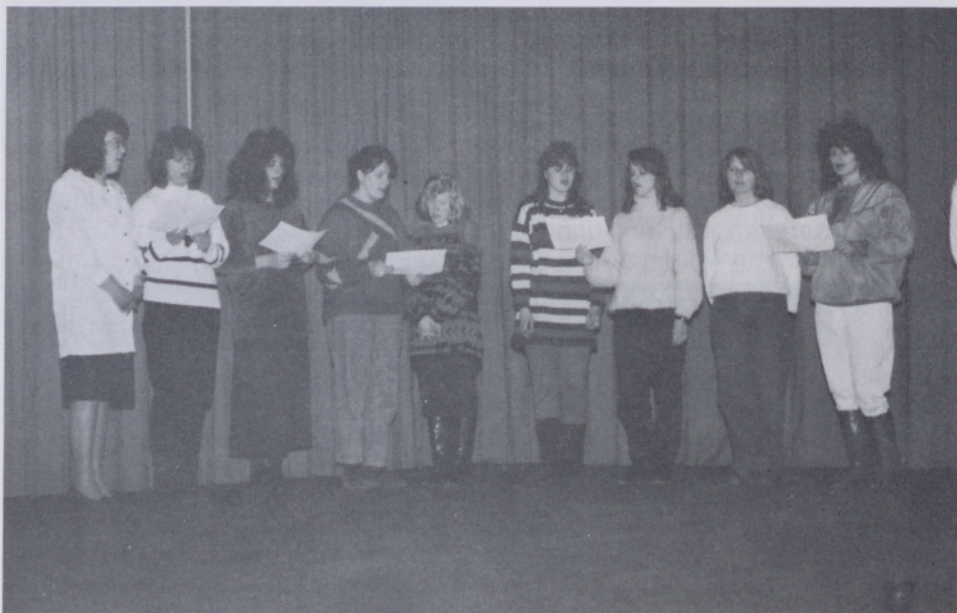
Del dekliškega pevskega zbora