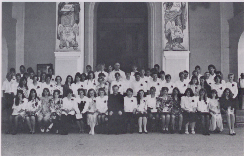
Osmošolci po izpovedi vere