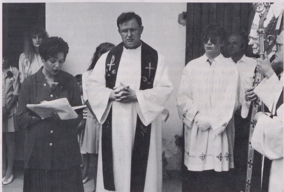
Blagoslovitev župnijske dvorane