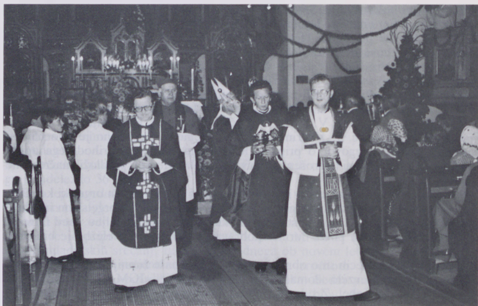
Blagoslovitev obnovljene cerkve