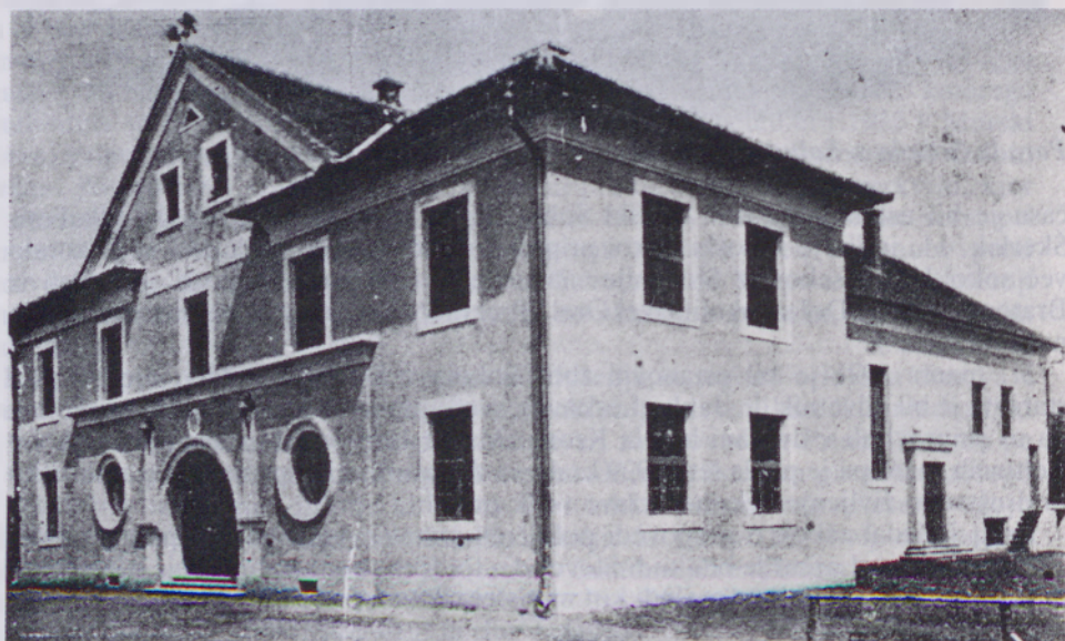
Sokolski dom v Soboti