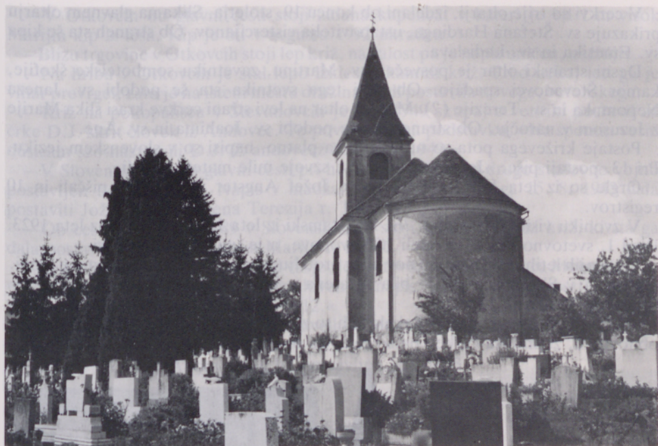
Župnijska cerkev v Števanovcih