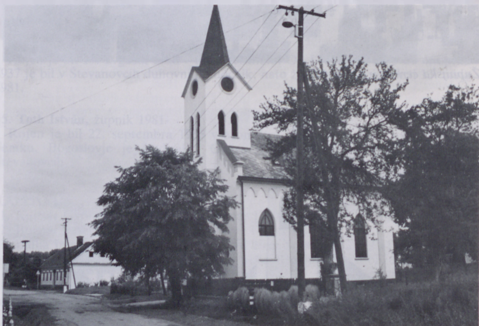
Kapela v Sakalovcih

Mariji posvečeno kapelo v Sakalovcih so zgradili leta 1922. Obe kapeli sta lepo obnovljeni, župnijska cerkev pa še čaka na obnovo.