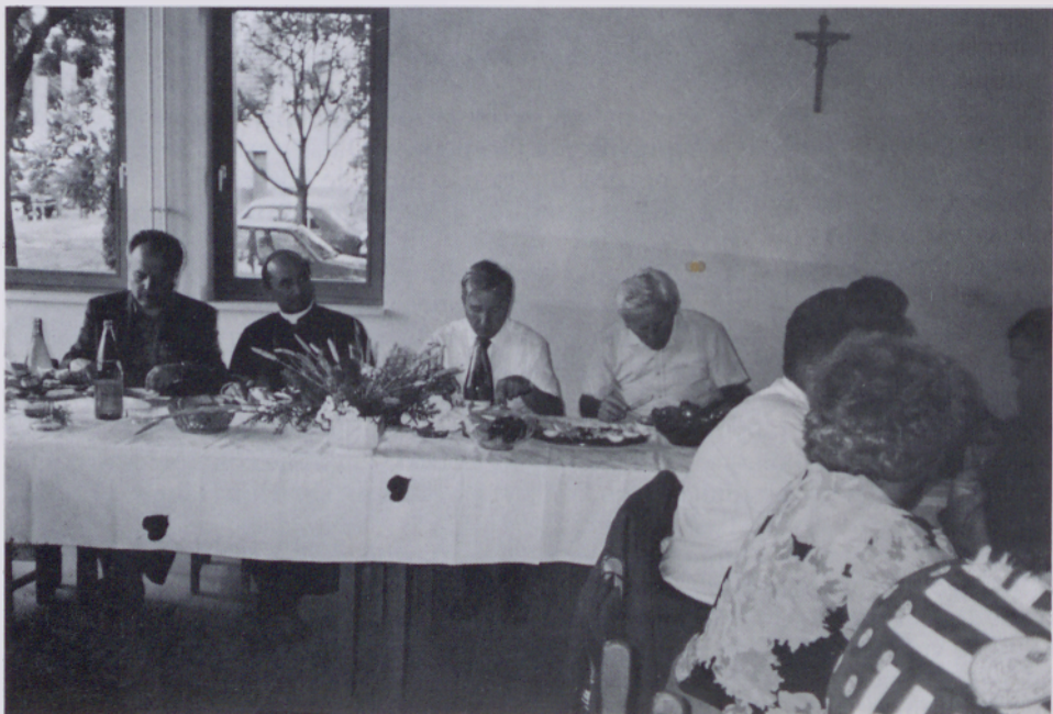
Po blagoslovitvi Duhovnega centra

ljena na svetilnik naše sedanjosti, da bi svetila vsem rodovom Pomurja tudi v tretjem tisočletju.«