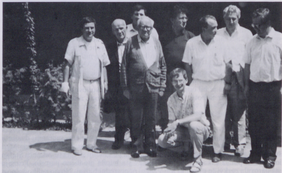
Udeleženci priprav na Kleklov simpozij

Vaščani Srednje Bistrice so z lastnimi sredstvi in s posrečeno roko arhitekta znatno povečali dosedanjo mrliško vežico. Naložba znaša nekako 25.000 DEM. Podjetje »Ferralit« je vlilo za njihovo mrliško vežo 32 kg težak zvon, ki ga bodo namestili na steber tik ob veži. Pred vežo stoji že tudi novi križ. Blagoslovitev vežice in zvona želijo imeti predzadnjo nedeljo v mesecu rožnega venca – oktobra 1993.