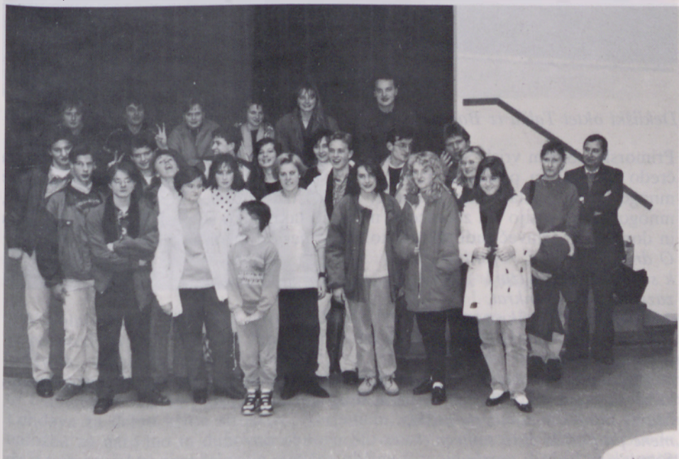
Mladi iz Bogojine v Berlinu

Za Slovence v Berlinu je bil čas od 22. do 25. januarja 1993 čas prave slovenske kulture, narodne in verske. To so bili dnevi petja in vriskanja, plesa in pogovorov, dnevi spoznavanja in pletenja novih prijateljskih vezi.