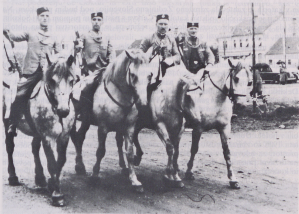
Parada Sokola v Soboti