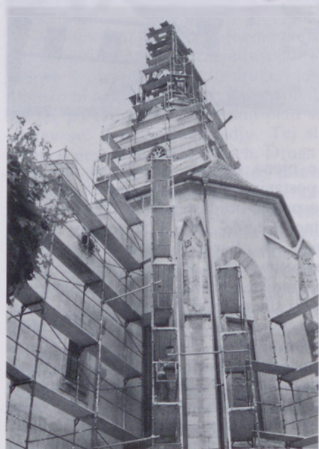
Obnova zvonika v Ljutomeru