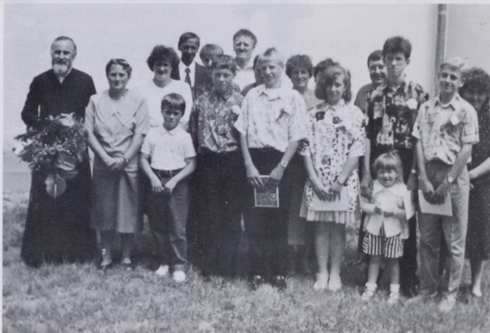
Dolenski osmošolci s starši