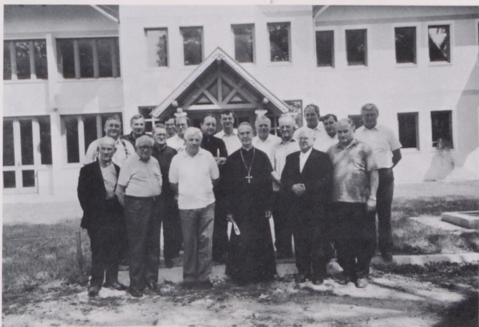
Duhovniki na duhovnih vajah v Kančevcih