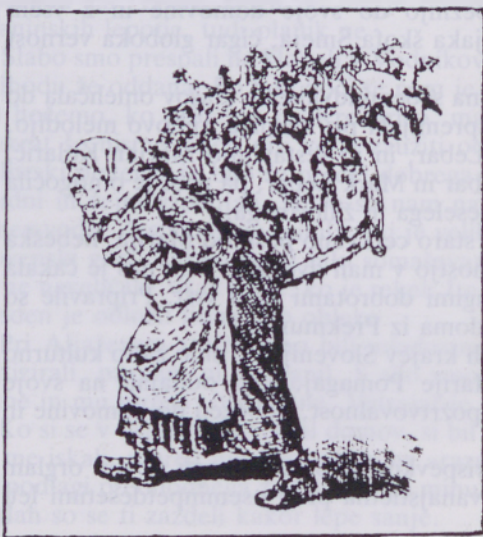
Kupinarka, risba Janosa Janka v prvem madžarskem strokovnem listu »Gallas« iz leta 1884.

Prav tako se je po drugi svetovni vojni razmahnilo vsesplošno trgovanje z živili s podeželja v mesta, pri čemer so se med Prekmurci najbolj uveljavili vaščani iz Odranec. To nas navaja k razmišljanju, da je takomenovani »turniški kot«, to se pravi vasi okoli Turnišča, že vseskozi obarvan z živahnim ljudskim trgovanjem. Obenem pa nam vse to dokazuje veliko mero iznajdljivosti teh ljudi, ki so zaradi slabih življenjskih razmer bili prisiljeni poiskati si dodatna sredstva za preživljanje. To jim je v veliki meri tudi uspevalo, kar pa je le ublažilo njihovo stisko, ni pa je moglo odpraviti.