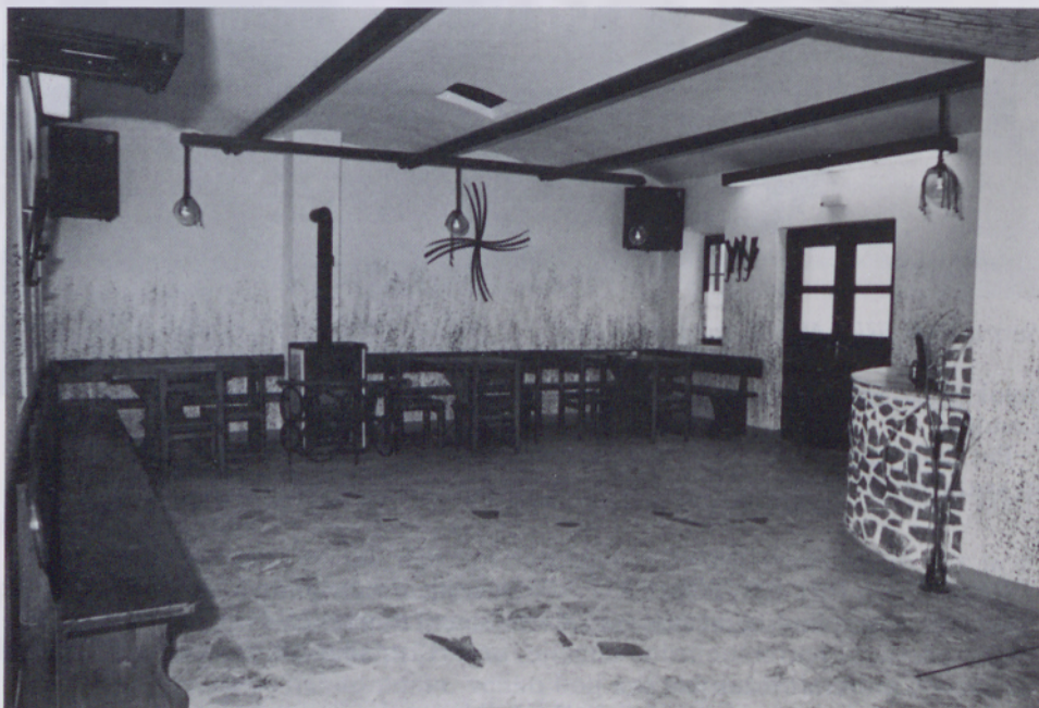
Prostor za razvedrilo

Meseca julija smo uredili in odprli s slovesno blagoslovitvijo prostor 60 m 2 površine, v katerem so mize, klopi ob zidu, šank z nealkoholno pijačo, pikado in možnost poslušanja glasbe. Zunaj na dvorišču je še igrišče za tenis. Prostor naj bi služil mladim in prav tako malo manj mladim. To naj bo prostor, kjer bi se poveselili, razvedrili in pokramljali, hkrati pa naj bo to tudi mesto, kjer lahko