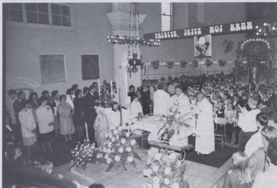
Prvoobhajanci sodelujejo pri maši

Imeli smo dva božična koncerta v sklopu praznovanja 250. obletnice župnijske cerkve. 3. januarja je bil božični koncert zborov iz naše župnije. 24. januarja pa