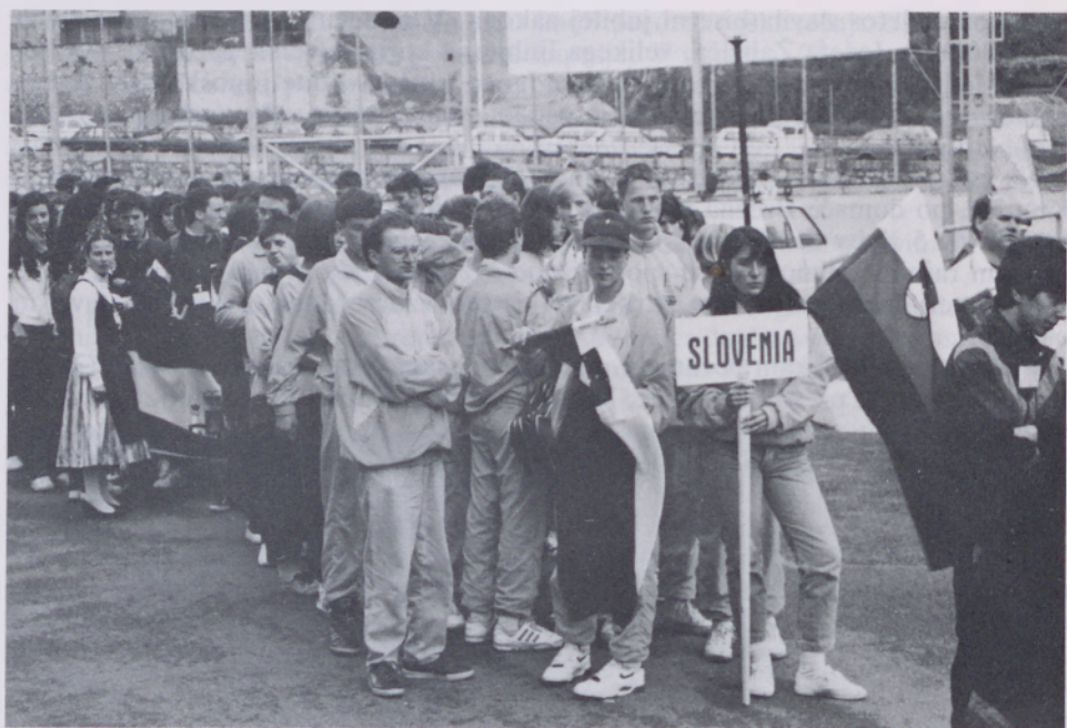
Verženska mladina na mednarodnem mladinskem srečanju