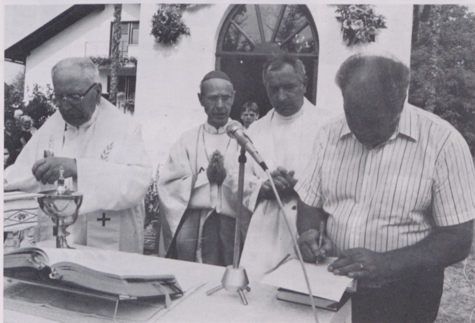
Lastnik kapele podpisuje ustanovno listino