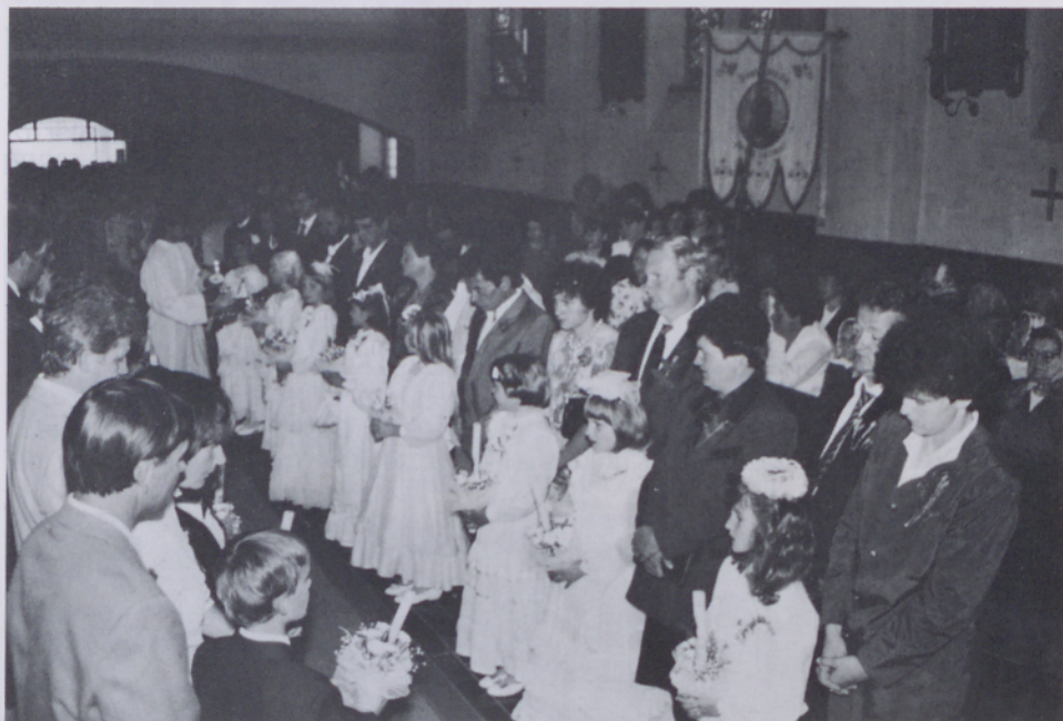
Prvo obhajilo v V. Polani

Slovesnost prvega sv. obhajila smo imeli v nedeljo 23. maja. Prvoobhajancev je bilo 13.