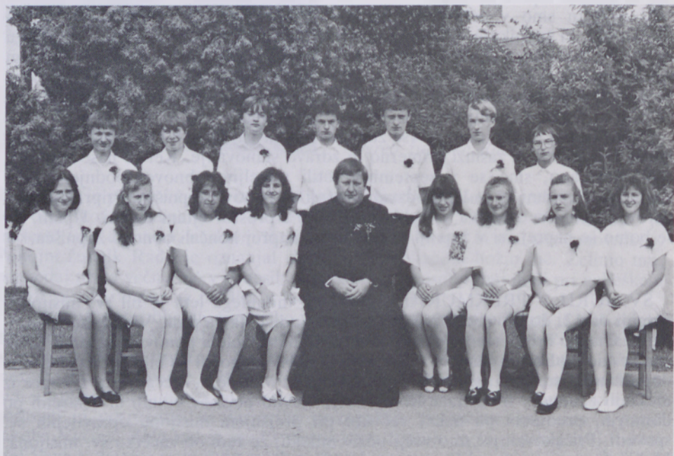
Izpoved vere pri Sv. Juriju v Prekmurju