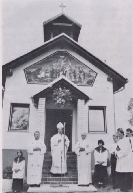
Kapela v Dolnjih Slavečih