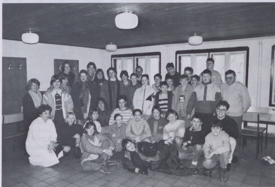
V Dominikovem domu na Pohorju

Če hočeš spoznati otroke, kakšni so, jih moraš popeljati za nekaj dni na skupne počitnice. Tam kaj kmalu spoznaš vsakega, kako »diha«, Kmalu vidiš, kdo je pripraven za delo, kdo se izmika, kdo zna kuhati, kdo ne, kdo je izbirčen in kdo ne, kdo rad molí in sodeluje pri maši in komu ne »diši«... Tako se je zbrala mešana smučarska ekipa iz Radencev in Veržeja in se podala na zimske počitnice