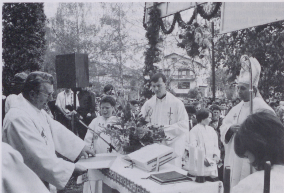
Župnikov pozdrav g. škofu

V župniji Bakovci se je začela priprava na tretjo birmo že dobro leto pred njo. Razen priprave birmancev smo veliko pozornost posvetili staršem in botrom birmancev, saj smo zanje pripravili kateheze vsako drugo nedeljo v mesecu. V zimskem času smo imeli teden dni molitvena srečanja po družinah, pri katerih so