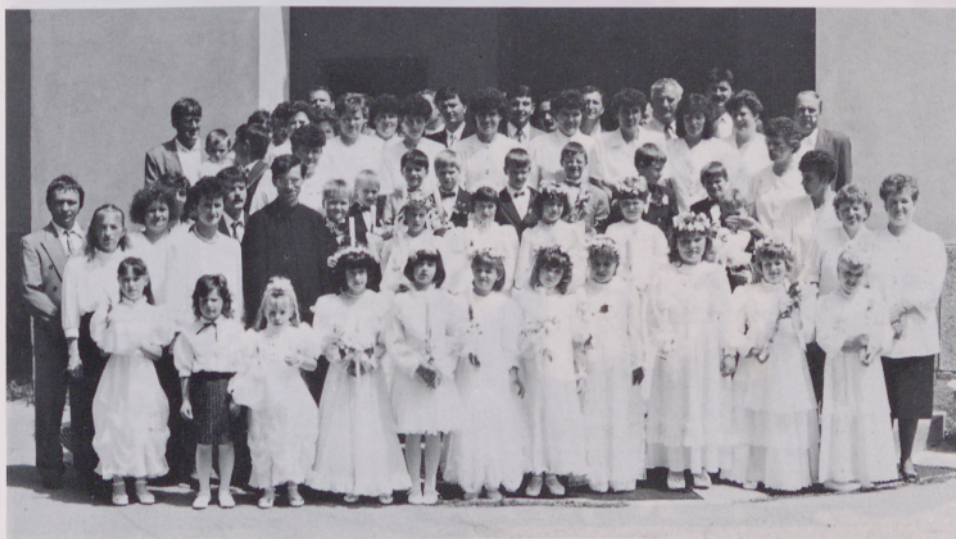
Prvoobhajanci s starši