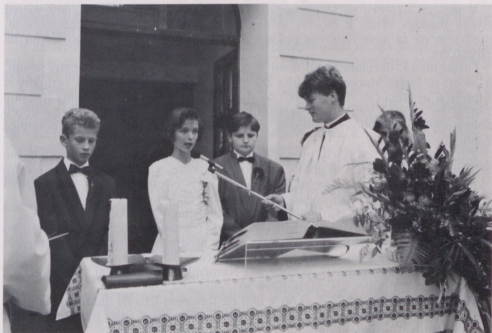
Birmanci pozdravljajo g. škofa