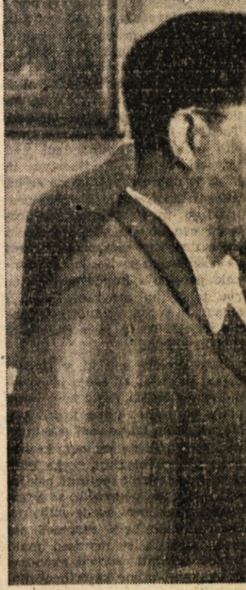
Edvard Kardelj, vodja jugoslovanske delegacije