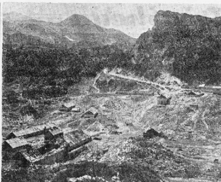
VELIKI IN MALI BOGATIN

Poletje, ki se je za en teden zakasnilo, skuša sedaj dohiteti zamujeno. Na Siciliji je toplomer pokazal v nedeljo 42 stopinj v senci. Lovorjevi gozdovi pod goro Etno so se zaradi vročine sami od sebe vžgali.