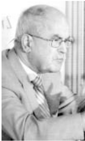
Minister Boštjan Žekš

Zunanji minister Samuel Žbogar in minister za Slovence v zamejstvu in po svetu Boštjan Žekš sta sprejela predstavnik slovenske manjšine v Italiji.