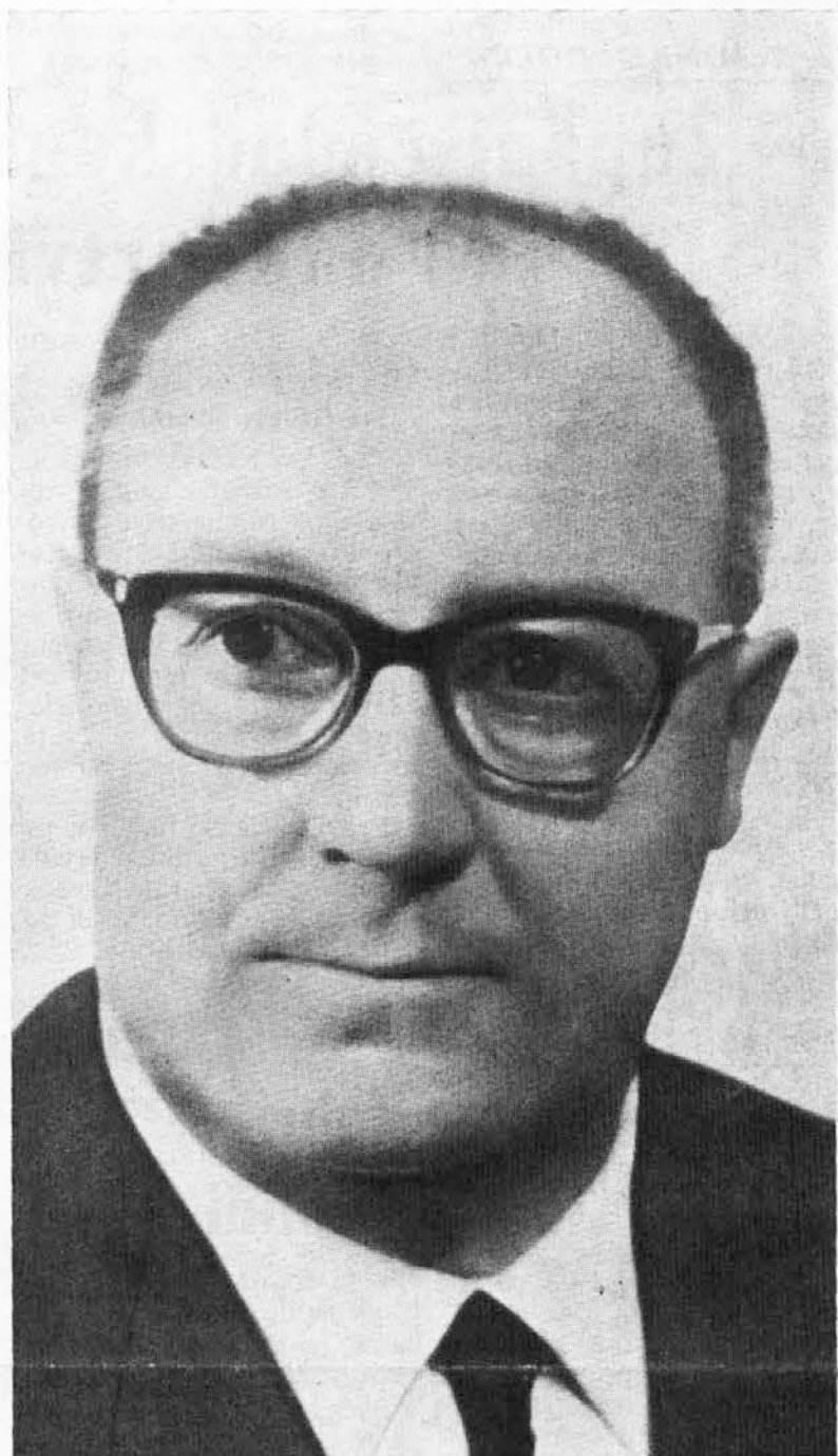
Predsednik italijanske republike Giuseppe Saragat

Disidentska komunistična levica, ki se je zbrala okoli dnevnika «Il Manifesto», je pred dnevi povzročila pravi škan dal z vestjo, da se vodstvo komunistov pogaja s Fanfanijem (pripisujejo mu, da je navznotraj zagovornik krepiteve izvršilne oblasti, kar komunistom ni najbolj všeč, da pa po drugi plati v zunanji politiki ni pretiran atlantist, kar bi bilo morda precej pri srcu Moskvi, ki so ji te vrste degolistični politični procesi še kar simpatični); komunisti so te očitke zavrnili, vendar samo deloma — dali so namreč vedeti, da se za kandidata še niso odločili, da pa so odprta vsa vrata za politični dogovor, to je, podprli bodo tistega kandidata, ki bo nudil več primernih garancij oziroma koncesij. Socialisti, ki so del vladne koalicije, pa so na zadnjem sestanku centralnega komiteja dali vedeti, da si od krščanske demokracije ne bodo pustili vsiliti človeka, ki jim ni povolji. V tem smislu so socialisti pustili odprtih dvoje vrat: ali širok dogovor med strankami za skupnega kandidata ali pa bodo postavili kandidaturo svojega človeka.