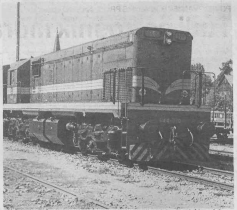
2.... na njihovo mesto pa stopa moderna dieselska in elektro vleka.