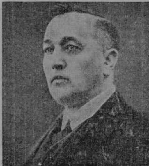
Notranji minister g. dr. Anton Korošec. (Slika je posneta ob priliki potovanja g. dr. Korošca v inozemstvo.)

v državno upravo veliko korupcijo, ki še ni v celoti iztrebljena. Dr. Korošček je povedal svoj program zelo na kratko: »Red in zakonitost hočem!« S svojo močno roko bo posegel vmes, pa bo uredil našo državo tako, da bodo zadovoljni tudi Srbi, Hrvati in mi Slovenci! Saj je jasno, da smo potrebovali moča, ki bo upravo države spravil na pot reda in zakonitosti! Veseli bomo, da je ta mož naš voditelj dr. Korošček!