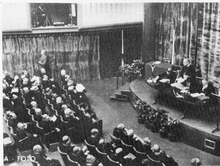
Prizor iz zasedanja konference italijanskih škofov, ki je bila pretekli teden v Rimu

Prejšnji teden v torek 13. junija se je mudila v Ljubljani skupina predstavnikov Slovencev s Tržaškega, z Goriškega in iz Beneške Slovenije. V Ljubljano jih je povabila mestna konferenca Socialistične zveze delovnega ljudstva (SZDL) Slovenije.