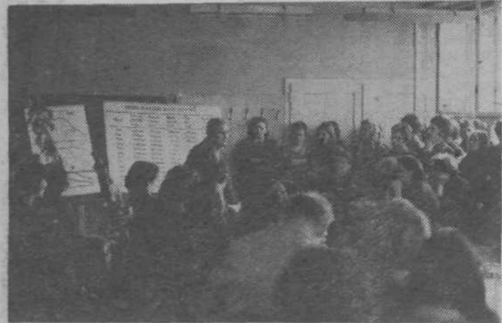
Sestanek obrata, oddelka ali samo delovne skupine je najprimernejša oblika neposrednega informiranja. Obravnava preteklih, sedanjih in bodočih dogodkov, je oblika dialoga in vključuje različne interese. Njegova slaba stran pa je, da je udeležba pogosto nepopolna, da so za najpotrebne širše tehnične in vsebinske priprave in da je „drag“.