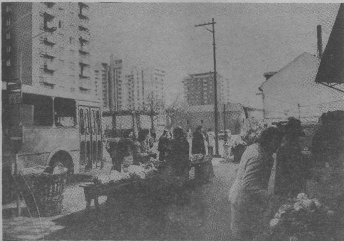
Sedanja moščanska tržnica je premajhna in ne ustreza povsem higiensko sanitarnim predpisom