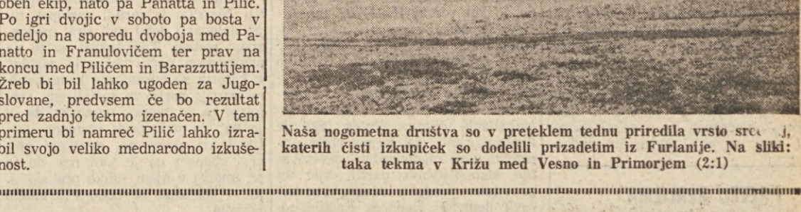
Naša nogometna društva so v preteklem tednu priredila vrsto srečanj, katerih čisti izkupiček so dodeli prizadetim iz Furlanije. Na sliki: taka tekma v Krizu med Vesno in Primorjem (2:1)